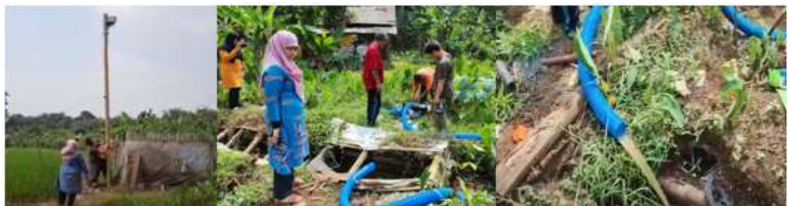
Gambar7. Pemasangan Alat Pemberdayaan Masyarakat (Pompa Air) dan pemasangan Lampu PJU

Selanjutnya Tim mencobakan mesin pompa air, Pompa adalah suatu peralatan mesin yang digunakan untuk memindahkan suatu cairan ( Fluida ) dari suatu tempat ketempat yang lain melalui media pipa dengan cara mendorong fluida langsung secara mekanik melalui saluran pipa atau merubah energi mekanik menjadi energi tekanan atau energi kinetic (Kurniawan, Saragih, & Hasballah, 2021). Dalam artikelnya menyebutkan bahwa Pada dasarnya dalam memilih suatu pompa air untuk tujuan maksud tertentu maka terlebih dahulu harus diketahui kapasitas alirannya serta head untuk mengalirkan zat cair/fluida yang akan dipompa. Sebuah pompa air biasanya untuk suatu kapasitas dimana (Q), head (H), dan putaran (n) tertentu maka karakteristik pada suatu putaran konstan secara teori derasnya aliran air (Debit Air) tergantung pada ketinggian (Head) dan putaran mesin pompa air. Hasilnya semua yang diuji coba sudah berhasil dalam waktu yang tidak terlalu lama, pelaksanaan pengmas ini membuahkan hasil yang bisa dimanfaatkan oleh Petani Andir Farm untuk budidaya lahan tambak lele ini.