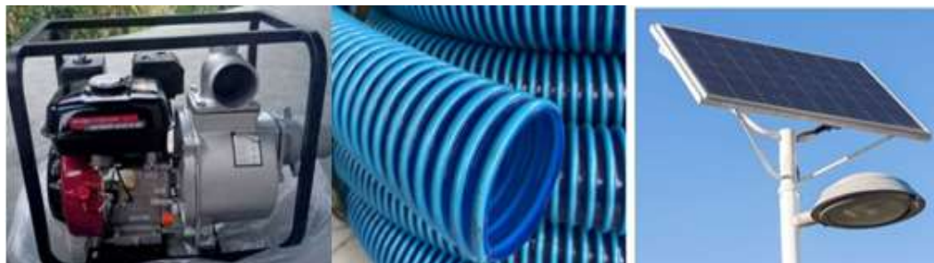
Gambar 3. Perangkat yang diperlukan dalam pengmas Pemberdayaan Masyarakat

Setelah melakukan survey lapangan maka dibuatlah rencana kerja untuk mempermudah program kegiatan masyarakat ini yaitu Tim PKM melakukan persiapan Pengabdian Masyarakat berupa penyiapan alat lampu panel surya dan motor pompa diesel penyedot air keramba juga berupa materi ajar Modul maintenance peralatan.