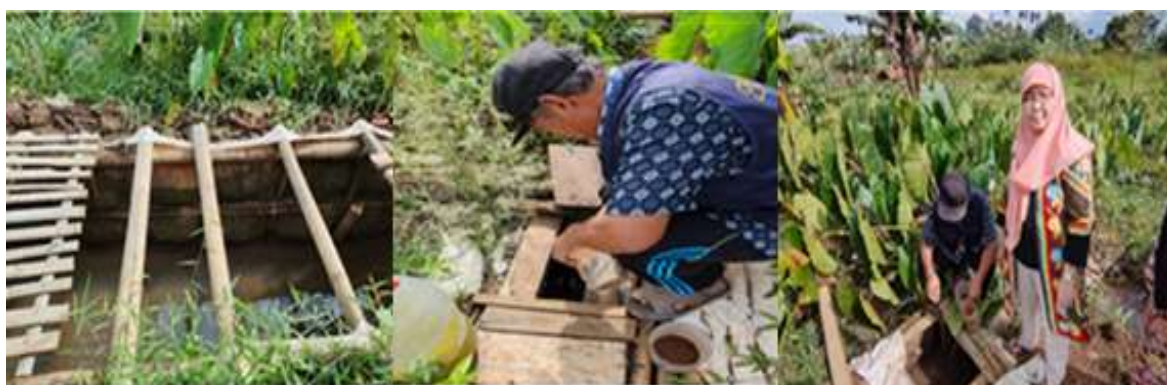
Gambar 1. Lokasi Pengmas Keramba Ikan lele Andir Farm