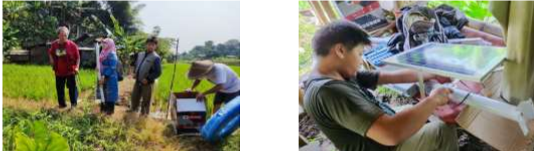
Gambar 4. Proses pelaksanaan pengmas di lokasi pengmas

diawali dengan Mempersiapkan segala sesuatu yang diperlukan di lokasi seperti alat-alat tukang untuk memasang lampu PJU dan untuk mencobakan mesin Diesel. Sumber tenaga menjalankan mesin pompa air bisa berbentuk solar atau bentuk teknologi sel photovoltaik. (Haddada, Jalil, Tarakka, & -, 2018). Dan (Pajarianto, 2019). Hasil yang dicapai adalah terpasangnya lampu PJU dan berhasilnya mesin Diesel Pompa air penyedot air keramba untuk mengosongkan keramba, ditunjukkan pada gambar :