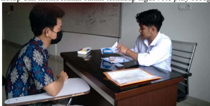
Gambar:2. Simulasi role playing servant leadership

Pengabdian memberikan instruksi awal dan menjelaskan metode selama 10 menit kemudian memanggil 2 nama mahasiswa sesuai urutannya untuk maju kedepan kelas bertindak sebagai masyarakat yang ingin mengurus pemberkasan pembukaan rekening Bank adalah rekannya dan yang satu bertindak sebagai figur servant leadership (mengenakan kerah berwarna putih) sementara yang bertindak sebagai figur role play nasabah (mengenakan kerah batik) Dalam sistem penilaian pengabdian memberikan poin-poin penting kemampuan teknis figur servant leadership yaitu: introduction , salam keramah tamahan, menyakan keperluan dan kebutuhan administratif yang akan diurus, tata cara ,membuka dan menutup map figur role play nasabah, body language , penguasaan materi, public speaking (etika berkomunikasi dan kecakapan fasih) , acuaity (ketajaman dalam analisa proses administrasi), kostum yang dikenakan, penghayatan terhadap peran, keuletan serta menutup dan memberikan salam terhadap figur role play sebagai nasabah.