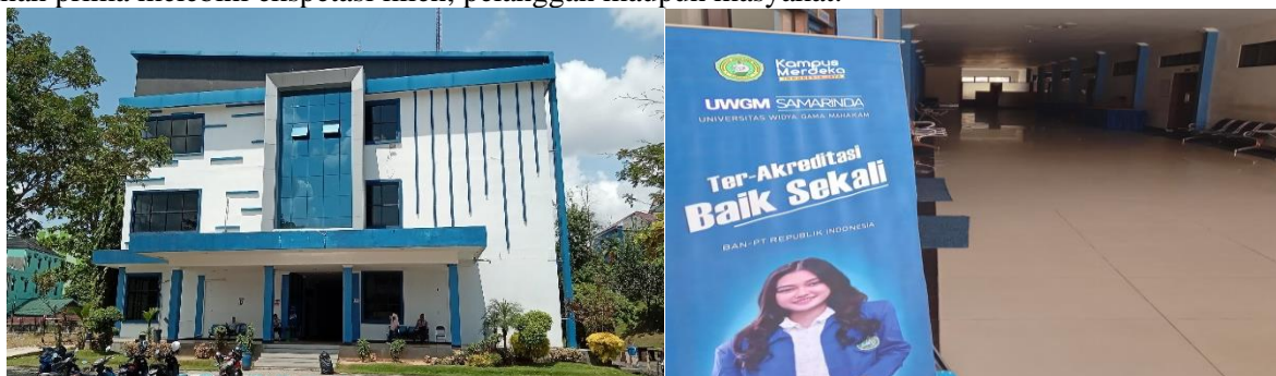
Gambar:1. Lokasi Kegiatan Pengabdian Universitas Widya Gama Mahakam Gedung D

Berdasarkan hasil identifikasi terhadap beberapa mahasiswa-mahasiswi Fakultas Ilmu Sosial dan Ilmu Politik Universitas Widya Gama Mahakam jurusan Administrasi Publik program mata kuliah khususnya yang berhubungan dengan pelayanan publik terhadap masyarakat belum terdapat praktik simulasi tata cara teknis layanan public service terhadap klien, pelanggan maupun masyarakat dan beberapa diantaranya masih belum sepenuhnya belum pernah diberikan praktikum simulasi tentang etika dan tata cara pemimpin dalam memberikan pelayanan, agar proses berjalan dengan baik maka ditanamkan kesadaran keterampilan dasar kepemimpinan tentang pentingnya melayani kebutuhan masyarakat sebagai bekal untuk terjun dunia kerja agar menjalankan proses birokrasi kepada masyarakat dapat mengambil langkah dalam memenuhi kebutuhan layanan prima melebihi ekspektasi klien, pelanggan maupun masyarakat.