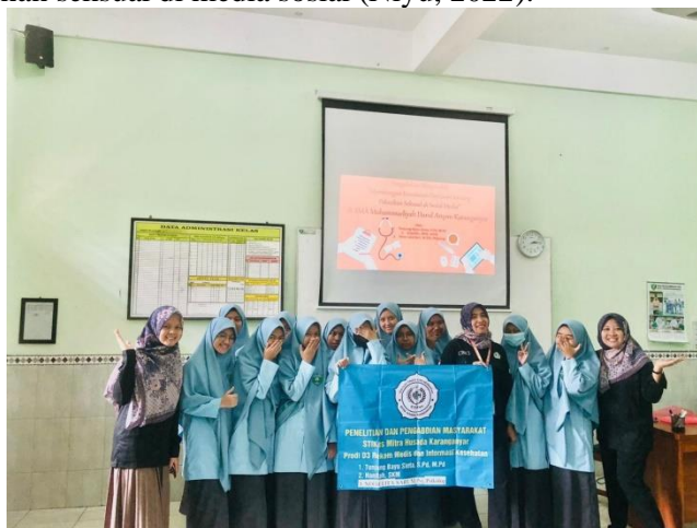
Gambar 4. Foto Bersama Siswi SMA Muhammadiyah Darul Arqom Karanganyar

Pertanyaan kedua yaitu tentang apa upaya yang bisa dilakukan untuk mencegah atau menanggulangi tindakan cyber sexual harassment , ada tiga 1) sensitisasi, yaitu pencegahan pelecehan seksual melalui penjangkauan, pembelajaran, pelatihan dan pengembangan komunitas yang dapat membawa perubahan sosial ke arah yang positif; 2) regulasi media sosial sebagai pengaman untuk meminimalisir pelecehan seksual dalam forum media sosial di era digital; 3) Sanksi berupa kebijakan dan aturan hukum yang mengatur pengelolaan internet atau media sosial, seperti regulasi yang menegakkan hukum kepatuhan publik sehingga para pelaku itu juga dapat ditindak dengan hukum yang dapat membuatnya jera sebagai konsekuensi dari pelaku pelecehan seksual di media sosial (Niyu, 2022).