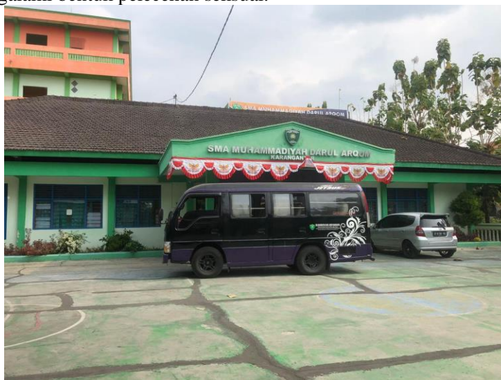
Gambar 1. Lokasi SMA Muhammadiyah Darul Arqom Karanganyar

Berdasarkan analisis situasi yang kami lakukan, terdapat beberapa permasalahan yang muncul yaitu kurangnya kesadaran siswi tentang bentuk dan cara pencegahan pelecehan seksual di media sosial serta cara mengatasi apabila mengalami bentuk pelecehan seksual.