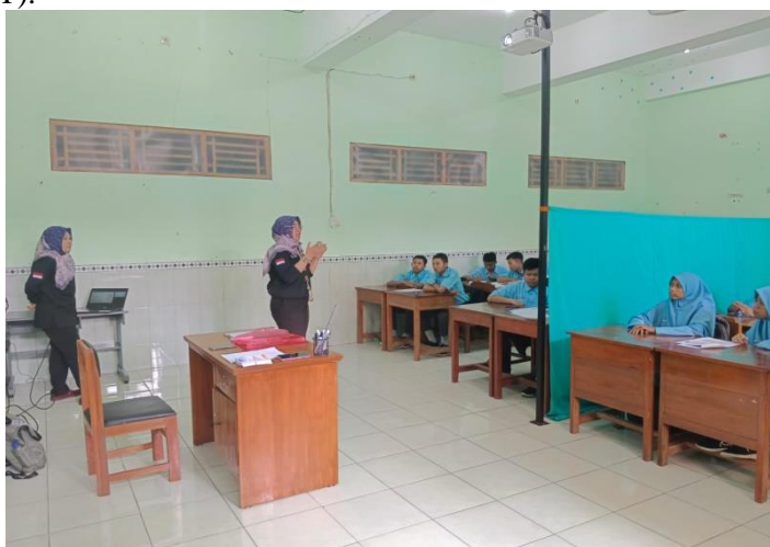
Gambar 2. Penyampaian materi oleh pelaksana

Kegiatan pengabdian ini dilakukan di SMA Muhammadiyah Darul Arqom Karanganyar dimulai terlebih dahulu dengan pelaksanaan koordinasi dengan pihak kepala sekolah, guru BK dan Guru Wali Kelas XI untuk kelancaran kegiatan dan mengoptimalkan partisipasi siswa terhadap kegiatan penyuluhan. Sebelum penyuluhan dilakukan, pelaksana memberikan pertanyaan terbuka tentang pengertian pelecehan seksual di media sosial namun masih banyak siswa yang belum bisa menjelaskan dengan benar definisi pelecehan seksual dan bentuknya dengan metode ceramah. Dimana metode ceramah efektif atau cocok digunakan pada kegiatan sosialisasi kelompok besar, mengingat jumlah siswa yang hadir ada 35 (Tiga Puluh Lima) orang (Sugiyono, 2018). Media yang digunakan pada saat menyampaikan materi yaitu dengan menggunakan Presentasi Power Point (PPT) .