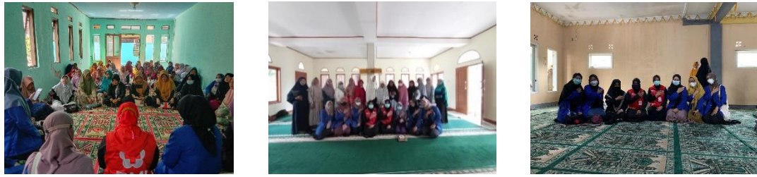
Gambar 3. Sosialisasi KPDD bersama ibu-ibu pengajian