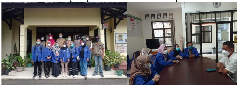
Gambar 2. Koordinasi mahasiswa dengan Kecamatan Warudoyong

Secara keseluruhan kegiatan berjalan dengan lancar sesuai dengan perencanaan semua pihak. Kegiatan donor darah berlangsung dengan suasana yang menyenangkan mulai dari sambutan pihak kelurahan, dosen, perwakilan mahasiswa dan pihak PMI kota Sukabumi serta diakhiri dengan adanya pembagian Dorprize. Hal ini memberikan kesan yang baik bagi para peserta dimana mereka bisa memahami tentang pentingnya donor darah bagi masyarakat setempat, Seluruh peserta yang terlibat begitu antusias mengikuti kegiatan donor darah. Hal ini dapat dilihat dari keaktifan peserta dalam setiap sesi yang berlangsung. Antusiasme yang tinggi ini juga dikarenakan materi dan demonstrasi yang digunakan sangat mudah dilakukan. Dalam sesi pemaparan materi terkait kegiatan donor darah dan para peserta serius dalam memperhatikan materi.