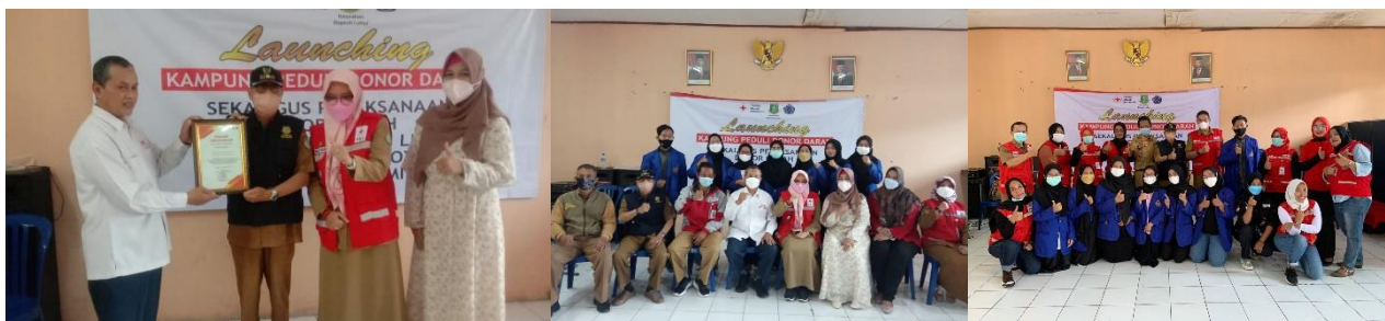
Gambar 5. Launching Kampung Peduli Donor Darah