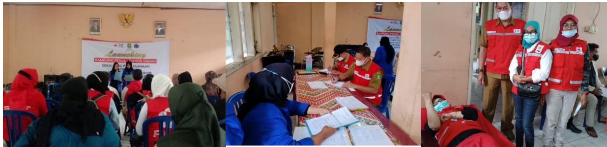
Gambar 4. Pelaksanaan Donor Darah di Kelurahan Dayeuhluhur