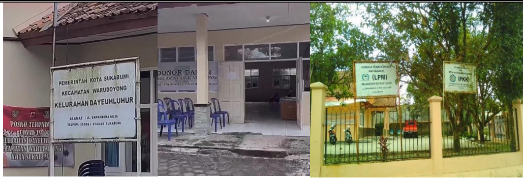
Gambar 1. Lokasi Kegiatan Pembentukan Kampung peduli Donor Darah