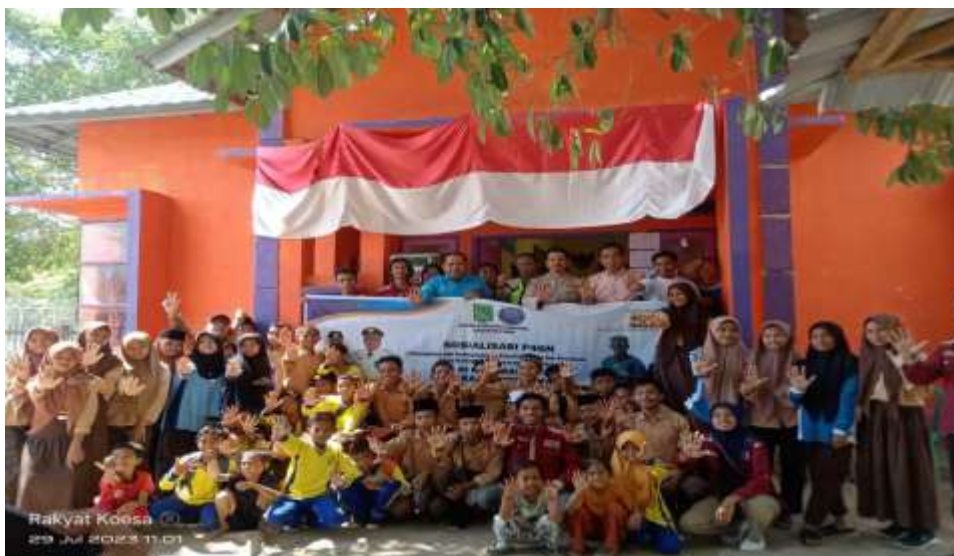
Gambar 3. Sesi Foto Bersama Peserta

langkah penting adalah melaporkan aktivitas mencurigakan yang terkait dengan narkoba kepada kepolisian. Kami juga dapat mendukung upaya pencegahan dengan menjadi contoh positif dalam lingkungan kami, membagikan informasi tentang bahaya narkoba kepada teman-teman, dan mendukung program-program edukasi anti-narkoba di komunitas; 3) mengenali tanda-tanda penyalahgunaan narkoba adalah langkah penting. Perubahan drastis dalam perilaku, penampilan fisik yang berubah, penurunan kinerja sekolah atau pekerjaan, serta pergaulan dengan teman-teman baru yang mencurigakan bisa menjadi tanda-tanda. Perhatian terhadap perubahan tersebut dan berbicara dengan individu yang terlibat adalah langkah awal dalam membantu mereka, dan 4) lingkungan sekolah dan masyarakat memiliki peran yang besar dalam pencegahan narkoba. Di sekolah, program edukasi anti-narkoba harus menjadi bagian dari kurikulum. Selain itu, lingkungan yang positif dan mendukung di sekolah dan masyarakat dapat memberikan alternatif yang sehat bagi siswa dan remaja. Komunikasi terbuka antara guru, orang tua, dan siswa juga penting dalam menciptakan lingkungan yang aman dan bebas narkoba. Akhir kegiatan, dilanjutkan dengan sesi foto bersama semua elemen dari kegiatan pengabdian ini.