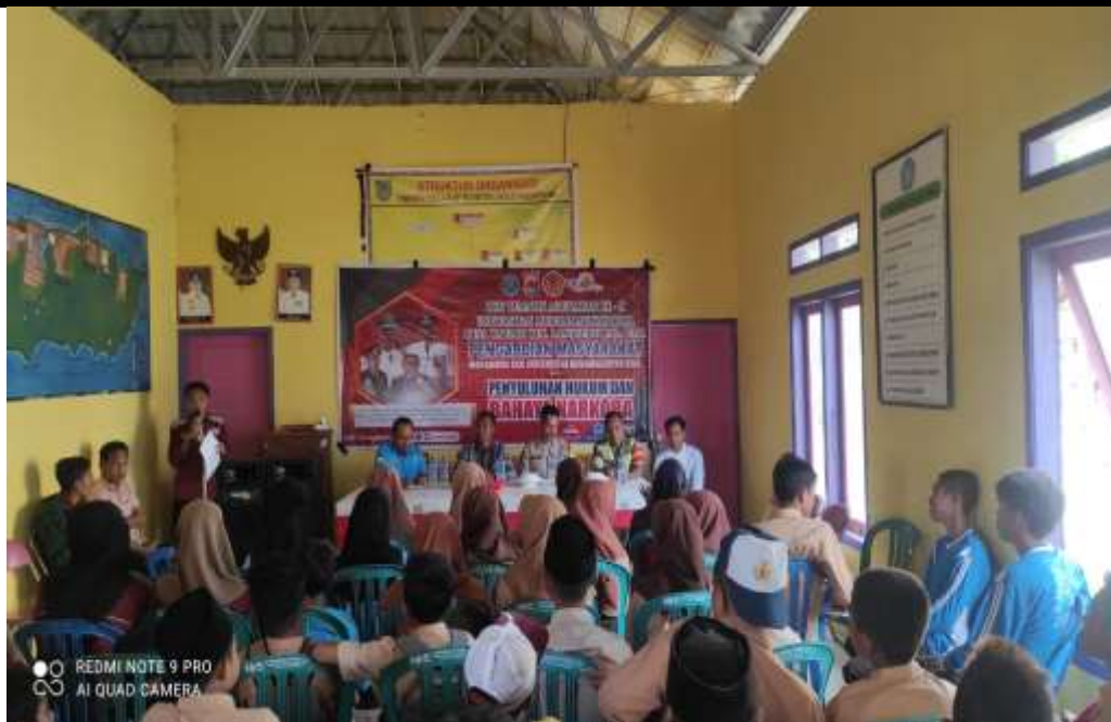
Gambar 1 : Lokasi Kegiatan Pengabdian Kepada Masyarakat