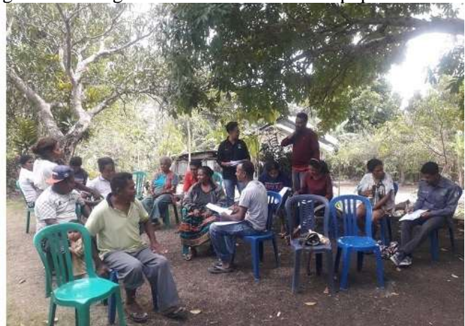
Gambar 2. Kegiatan perencanaan partisipatif Penerapan Iptek Masyarakat (PIM) Program Studi Pengelolaan Hutan Politeknik Pertanian Negeri Kupang

Terdapat dua jenis data yang diolah dan dianalisis, yaitu data kuantitatif dan data kualitatif. Data kuantitatif diolah menggunakan aplikasi Microsoft Excel 2013 . Data dianalisis menggunakan tabel frekuensi, grafik atau diagram untuk melihat data awal responden untuk masing-masing variabel secara tunggal menggunakan aplikasi Microsoft Excel 2013 serta menganalisis ada atau tidaknya hubungan antar variabel yang berskala ordinal dengan menggunakan uji korelasi Rank Spearman . Uji korelasi Rank Spearman dalam penelitian ini digunakan untuk menganalisis hubungan karakteristik individu meliputi usia, jenis kelamin, tingkat pendidikan, dan tingkat pendapatan dengan perilaku individu, meliputi aspek kognitif, afektif, dan konatif.