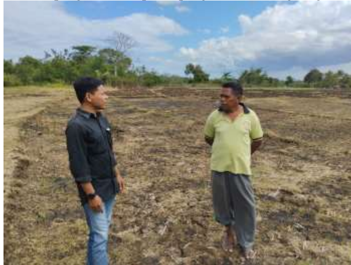
Gambar 1. Lokasi kegiatan Penerapan Iptek Masyarakat (PIM) Program Studi Pengelolaan Hutan Politeknik Pertanian Negeri Kupang

pengetahuan lingkungan dan perilaku ramah lingkungan. Perubahan perilaku manusia dengan lingkungannya terjadi karena interaksi baik mempengaruhi maupun dipengaruhi oleh lingkungan hidupnya.