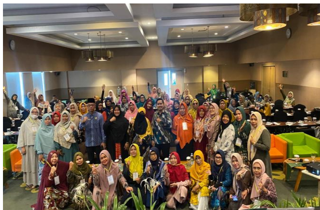
Gambar 2. Peserta Kegiatan

Pelatihan kewirausahaan yang telah dilaksanakan melalui kolaborasi ini menunjukkan hasil bahwa sebagian besar peserta adalah pelaku Usaha Mikro Kecil Menengah dalam bentuk makanan minuman, dan mayoritas pebisnis UMKM adalah ibu-ibu yang ada di Kota Pekanbaru dengan semangat berwirausaha yang luar biasa. Adapun hasil dari pelaksanaan kegiatan pengabdian sebagai berikut :