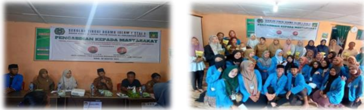
Gambar 4. Sambutan Kepala Desa Simpang Pulo Rambung Dan Masyarakat Yang Berpartisipasi Dalam Pengabdian Masyarakat

Seiring berjalannya proses kegiatan sosialisasi tentang stunting tersebut, ada beberapa ibu yang bertanya tentang apakah stunting merupakan faktor bawaan sejak lahir. Ada juga ibu yang bertanya tentang apa yang harus dilakukan jika ternyata anak mereka ada yang terkena stunting. dari beberapa pertanyaan yang diberikan ibu-ibu di desa tersebut telah menunjukkan jika ada beberapa anggota masyarakat yang kurang memahami arti pentingnya menutrisi anak-anak dari dalam kandungan sampai 1000 hari kelahiran mereka. Nutrisi yang diberikan kepada anak bukan nutrisi sembarangan. Ada tahapan usia anak dalam menikmati makanan mereka di piring. Pemberian makanan tidak sesuai usia anak dapat menjadi salah satu penyebab stunting. hal ini karena anak tidak ternutrisi dengan baik dan seimbang.