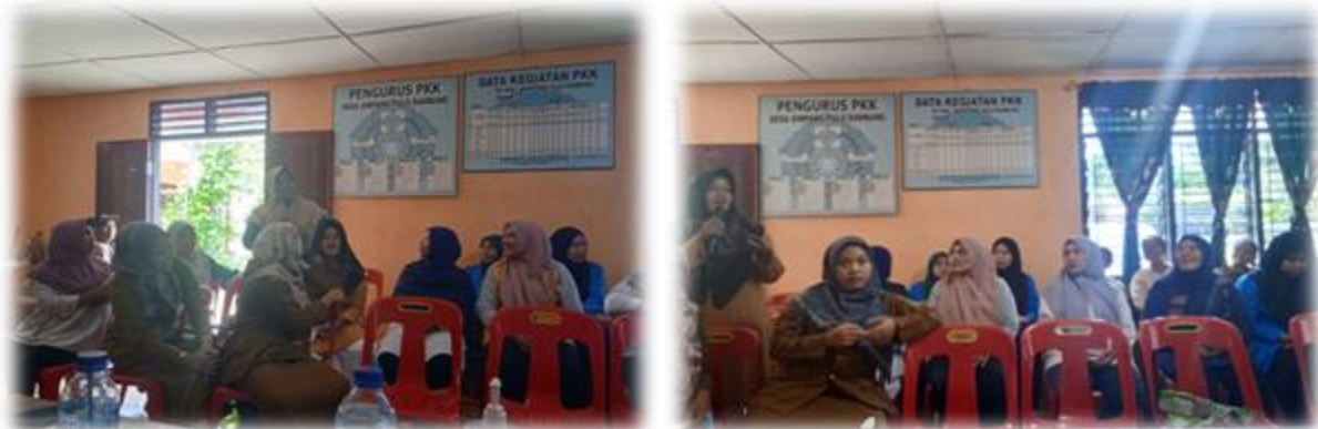
Gambar 3. Tanya Jawab Dan Diskusi Para Ibu Tentang Stunting

Pelaksanaan Pengabdian Masyarakat dilaksanakan pada tanggal 28 Agustus 2023 tepat pukul 10.00 WIB di balai Desa Simpang Pulo Rambung, Kecamatan Bahorok, Kabupaten Langkat. Lebih dari 30 orang ibu-ibu didesa tersebut turut hadir pada acara sosialisasi pencegahan stunting pada anak usia dini serta dampaknya pada faktor pendidikan dan ekonomi. Ketua tim mulai mempresentasikan bahaya stunting serta usaha-usaha pencegahannya sedini mungkin kepada para ibu didesa tersebut. beberapa video tentang ciri-ciri, gejala, serta dampak stunting juga diputar ke hadapan para ibu agar mereka lebih memahami stunting itu sendiri. ketua tim menggunakan metode tanya jawab dalam sosialisasi tersebut untuk memudahkan para ibu mengakses berbagai informasi mengenai bahaya stunting tersebut. ketua tim sekaligus pemateri juga membuka forum diskusi mengenai stunting ini