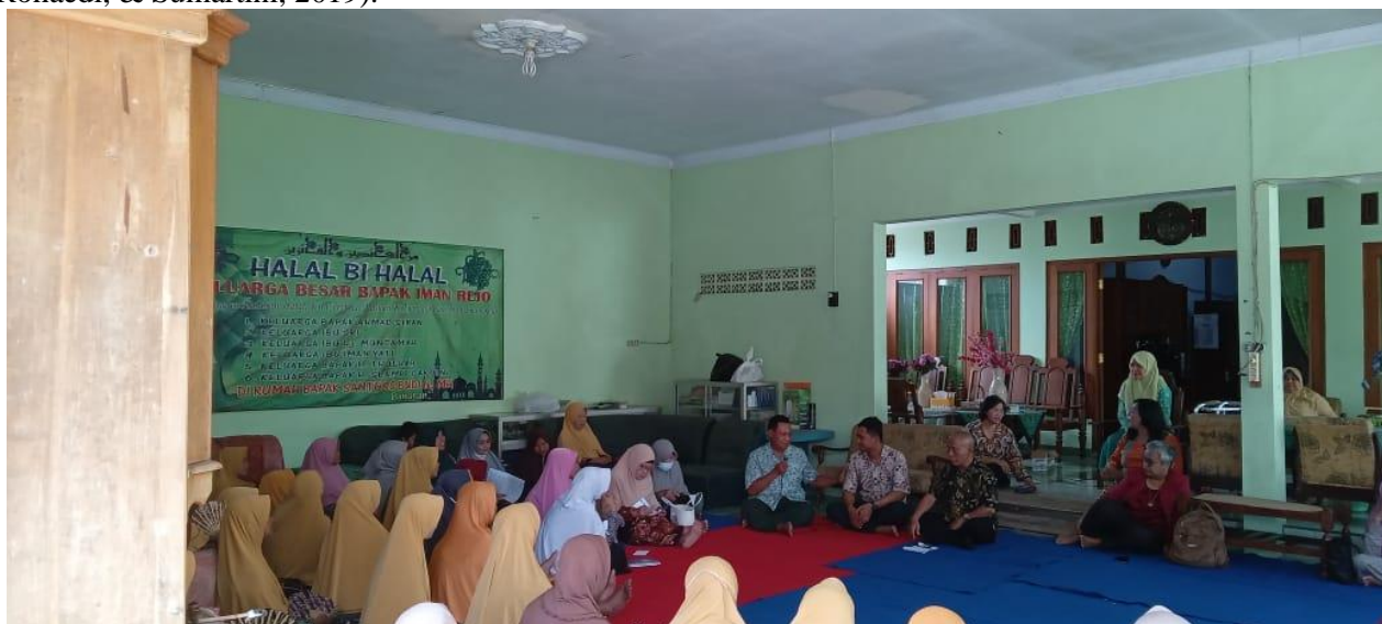
Gambar 2. Kegiatan sosialisasi

Pengertian Perjanjian Kawin. Perjanjian kawin diatur dalam Pasal 29 Undang-Undang No. 1 Tahun 1974 Tentang Perkawinan pengaturan pasal 2 ayat 1 UU Perkawinan no. 1 Tahun 1974 suatu perkawinan dianggap sah dengan anggapan perkawinan tersebut dilakukan menurut hukum agama serta keyakinannya masing-masing. kalau apa yang disiratkan oleh hukum setiap agama serta keyakinan mencakup pengaturan-pengaturan yang berlaku bagi pengumpulan serta pembedaan mereka secara tegas sepanjang tidak bertentangan atau dalam hal apa pun ditentukan dalam undang undang. Perkawinan tersebut dipandang tidak sah serta tidak mempunyai akibat yang sah selaku ikatan perkawinan. Dengan demikian, pernikahan sarat dengan nilai-nilai serta harapan buat menjadikan kehidupan rumah tangga yang ceria serta tak lekang oleh waktu (Rahmawati, Rohaedi, & Sumartini, 2019).