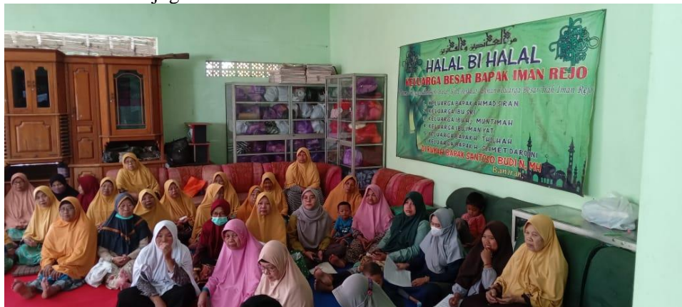
Gambar 3. Sosialisasi Pernikahan Dini

memikirkan usia mereka, sehingga dengan asumsi seseorang melamar anak mereka, mereka akan segera menawarkan anak mereka meskipun dia belum cukup dewasa, sebagaimana diatur dalam UU Perkawinan. Dengan cara yang berbeda mereka akan membangun usia sehingga anak-anak mereka bisa menikah. Bukan hanya wali, dari sisi anak-anak juga.