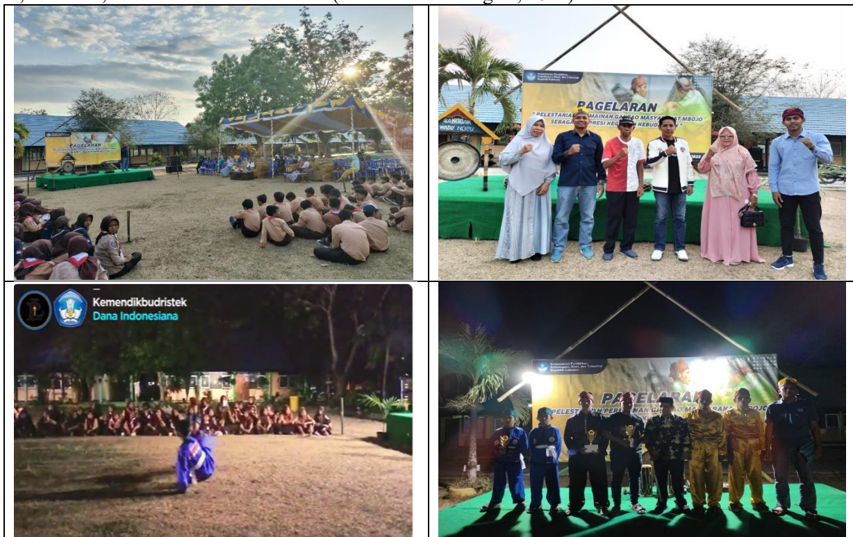
Gambar 2. Keterlibatan Berbagai Pihak di Kegiatan Gantao

Bahwa banyak yang mengenal dan memiliki minat yang tinggi terhadap olahraga dengan melalui permainan olahraga tradisional. Untuk mencapai tujuan pembelajaran olahraga para guru atau pelatih melakukan modifikasi dengan memberikan model permainan olahraga tradisional dengan harapan tercapainya proses pembelajaran olahraga (Fahmi, 2022). Permainan olahraga tradisional gasing, ketapel, dan egrang batok. Selain dari itu siswa beranggapan positif dan tertarik, karena pada zaman modern ini permainan tradisional juga tidak mau kalah harus dikembangkan agar membuat seseorang penasaran dan tertarik untuk memainkannya (Handoko & Gumantan, 2021). Permainan tradisional cocok dimainkan oleh siswa sekolah dasar karena dapat melatih kedisiplinan, kerjasama, cara berfikir dan bertindak. Pada permainan hadang siswa dapat melatih kerjasama dapat bermanfaat bagi tumbuh kembang anak yaitu melatih kelincahan. Pada permainan kasti dapat meningkatkan konsentrasi anak. Pada permainan kucing tikus juga dapat melatih kerjasama dan pada permainan kereta api masuk terowongan dapat melatih kerjasama serta