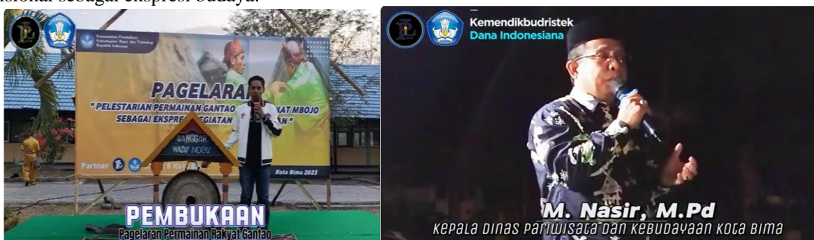
Gambar 2. Atraksi Permainan Rakyat dan Olahraga Tradisional Gantao

Olahraga tradisional merupakan permainan asli rakyat mbojo sebagai aset budaya yang memiliki unsur olah fisik secara tradisional. Selain itu, permainan tradisional merupakan warisan budaya sebagai sarana bagi anak untuk memperoleh pengalaman gerak yang berguna bagi pertumbuhan dan perkembangan fisik anak. Oleh sebab itu perlu dilakukan bimbingan secara intensif sehingga dapat dilestarikan olahraga tradisional secara berkelanjutan agar dapat dirumuskan the role of the games (Irfan, 2022). Budaya yang berkaitan permainan dan olahraga tradisional masyarakat Bima sangat banyak, namun seiring dengan waktu permainan-permainan ini mulai asing dilakukan oleh generasi modern. Sehingga keberlangsungan dari budaya permainan dan olahraga tradisional dikhawatirkan akan punah, sebab pelaku-pelaku budaya tersebut satu-persatu sudah tidak ada (meninggal dunia). Belum lagi masifnya program gerakan melestarikan budaya permainan dan olahraga tradisional oleh pemerintah, tantangan lain adalah permainan dan olahraga tradisional masyarakat Bima tidak diajarkan di sekolah. Tantangan-tangan ini tentu harus mampu ditemukan solusi untuk menggaungkan kembali kegiatan kebudayaan berupa pagelaran permainan rakyat dan olahraga tradisional sebagai ekspresi budaya.