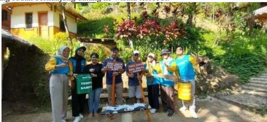
Gambar 4. Pembersihan Area Curug Masigit

Terdapat permasalahan lain di Desa Wisata Pasanggrahan yang menjadi persoalan yaitu masalah sampah. Mahasiswa melakukan program kerja yaitu membuat tong sampah organik dan anorganik yang nantinya akan dipasang di area tempat wisata curug masigit Desa Pasanggrahan. Kegiatan ini dilakukan untuk mengurangi sampah yang berserakan di area objek wisata yang ada di Desa Pasanggrahan. Demi menunjang ekowisata di Desa Pasanggrahan, khususnya di sekitar Sumber Air Cipondok, minimnya akses jalan menuju Sumber Air Cipondok berharap pemerintah dapat mempercepat progres pembangunan jembatan yang merupakan akses jalan menuju Sumber Air agar lebih meningkatnya pengunjung ke tempat tersebut. Desa Pasanggrahan bukan hanya memiliki potensi sumber daya air yang melimpah, tetapi Desa Pasanggrahan juga memiliki potensi UMKM sebagai produsen makanan ciri khas yang kualitas produknya perlu ditingkatkan, untuk produk lokal masuk ke destinasi wisata sebagai oleh-oleh ciri khas dari desa pasanggrahan yang sudah berkunjung datang ke wisata tersebut.