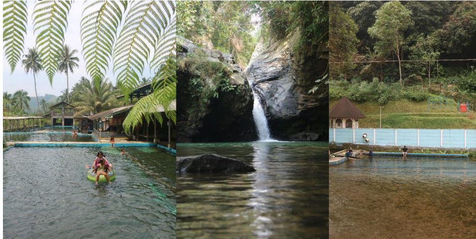
Gambar 4. Sumber Mata Air Cipondok, Mata Air Cimincul, dan Curug Masigit

wisata belum tertata dengan rapih, kurangnya fasilitas sarana dan prasarana. Faktor eksternalnya yaitu pesatnya perkembangan teknologi, banyaknya dukungan dari pemerintah pusat dan provinsi, semakin meningkatnya keinginan wisatawan untuk berlibur.