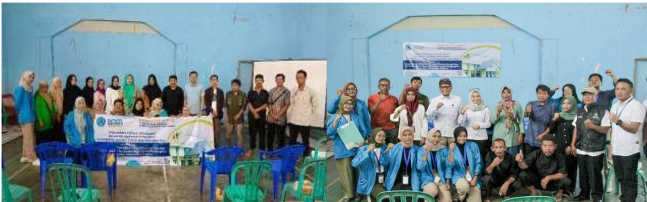
Gambar 1. Sosialisasi Bersama Disparpora, Team Javlec dan Workshop di Aula Desa

Langkah utama yang perlu dilakukan yaitu dengan melakukan sosialisasi kepada masyarakat terkait pentingnya pengembangan desa wisata, keterlibatan dan kesadaran masyarakat dalam pengelolaan ekowisata. Menurut (Qomariah, 2009) ekowisata adalah pariwisata yang dipergunakan oleh masyarakat dalam menikmati berbagai jenis keanekaragaman hayati tanpa merusaknya. Wisata ini identik dengan berbagai aktifitas pendidikan, seperti penelitian, dan lain sebagainya. Berikut lokasi kegiatan dan PKM yang dilaksanakan.