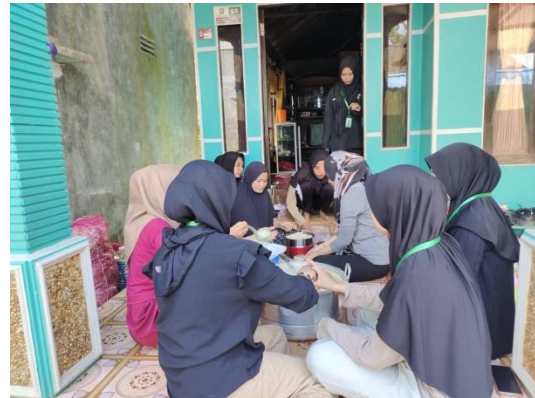
Gambar 3 Proses Pengemasan Bubur Asyura