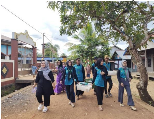
Gambar 4 Proses Pembagian Bubur Asyura