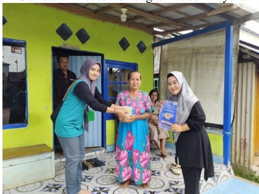
Gambar 6 Pembagian Bubur Asyura