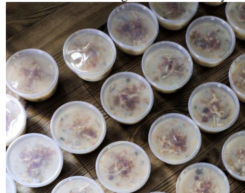
Gambar 5 Hasil Bubur Asyura