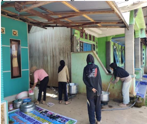
Gambar 2 Proses Pembuatan Bubur Asyura

Tradisi bubur Asyura ini sangat bermakna bagi masyarakat Desa Sungai Paring karena kegiatan ini belum pernah dilaksanakan. Sehingga para masyarakat sangat antusias dalam menjalani pembuatan bubur Asyura ini dan dapat mewariskan pengetahuan lokal dari para leluhur dalam menghadapi berbagai persoalan hidup (Rosadi, Mumfangati, and Nursugiharti 2023).