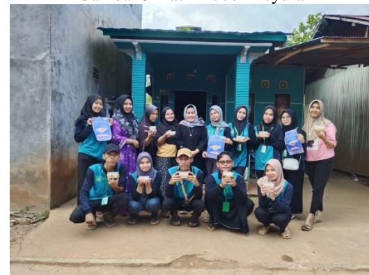
Gambar 7 Foto Bersama Ibu-Ibu PKK Harapan Ibu