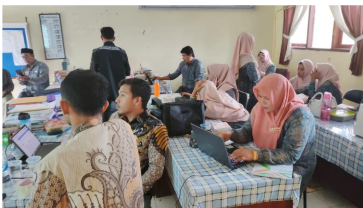
Gambar 7. Saat Pelatihan