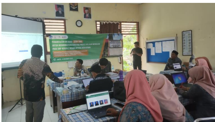
Gambar 6. Pelatihan Penggunaan Aplikasi Bank Soal dan Pendampingan Tim Pengabdian