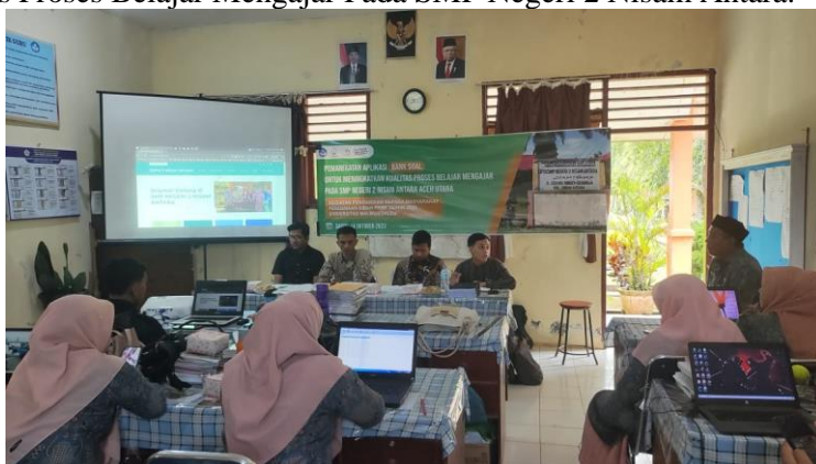
Gambar 5. Pembukaan Pelatihan Penggunaan Aplikasi Bank Soal

dikarenakan sejalan dengan tujuan sekolah dan keinginan seluruh pihak agar mutu pendidikan dan pengajaran semakin maju dan pembelajaran kedepan lebih sempurna. Pihak sekolah juga memfasilitasi segala kebutuhan tim pelaksana selama program ini berlangsung Pemanfaatan Aplikasi Bank Soal Untuk Meningkatkan Kualitas Proses Belajar Mengajar Pada SMP Negeri 2 Nisam Antara.