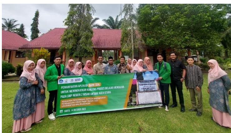
Gambar 9. Dokumentasi Setelah Pelatihan