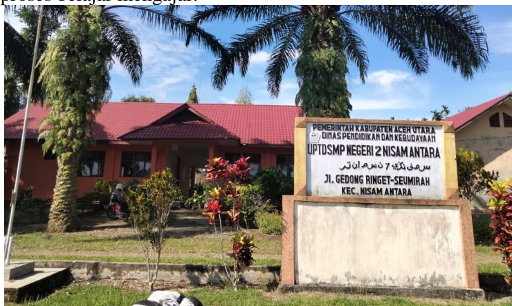
Gambar 1. Lokasi Pengabdian