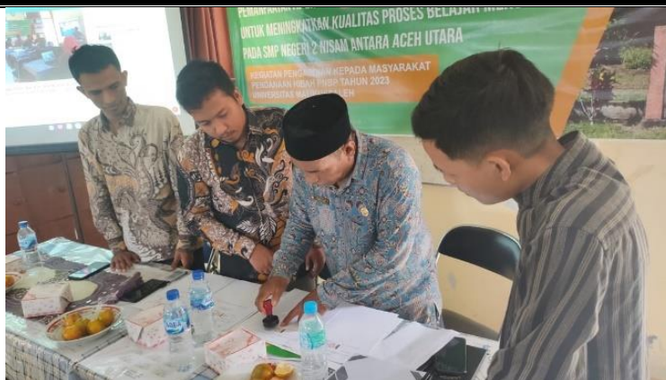
Gambar 8. Penandatanganan MoA dan IA oleh Kepala Sekolah