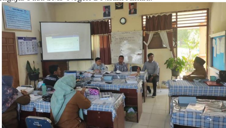
Gambar 2. Survey ke SMP Negeri 2 Nisam Antara

Indikator pencapaian keberhasilan kegiatan pengabdian ini ialah dengan adanya kegiatan ini diharapkan tenaga pendidik dari pemanfaatan aplikasi bank soal untuk meningkatkan kualitas proses belajar mengajar pada SMP Negeri 2 Nisam Antara adalah dapat mempermudah penyusunan soal-soal ujian yang sesuai dengan kurikulum dan standar kompetensi. Aplikasi bank soal ini juga diharapkan dapat membantu tenaga pendidik dalam mengelola data hasil ujian, memberikan umpan balik kepada siswa, dan melakukan evaluasi