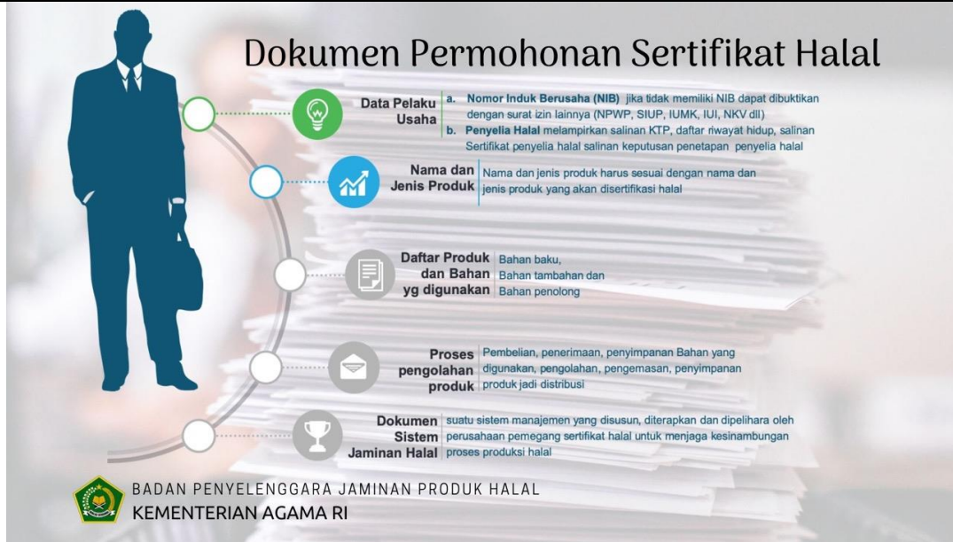
Gambar 3. Contoh Dokumen Permohonan Sertifikat

Rincian biaya pembuatan sertifikat halal