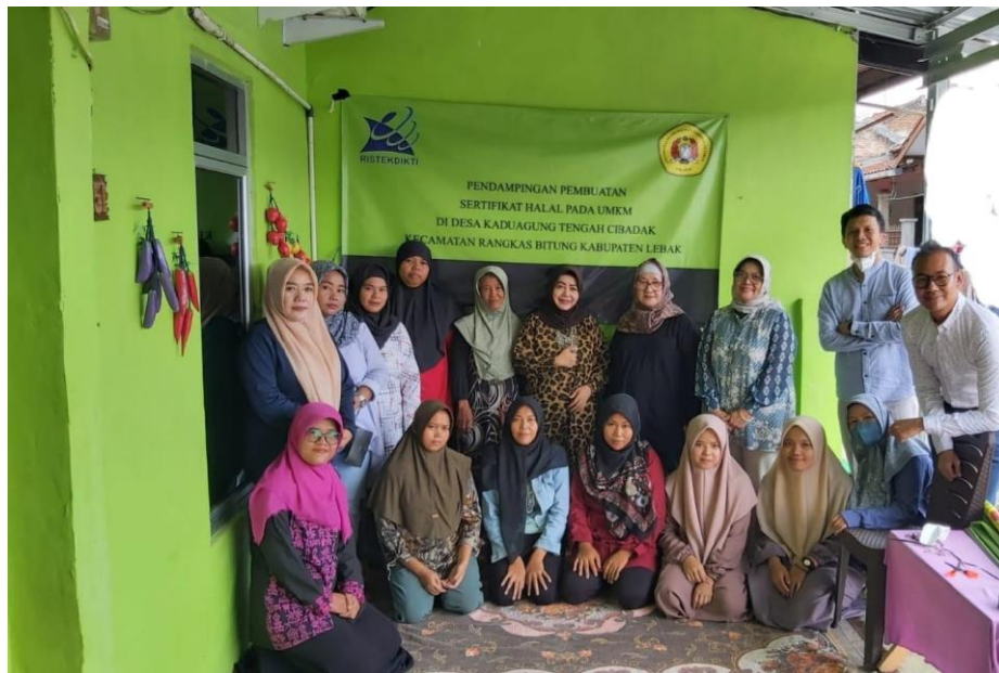
Gambar 2. Pelaksanaan Kegiatan