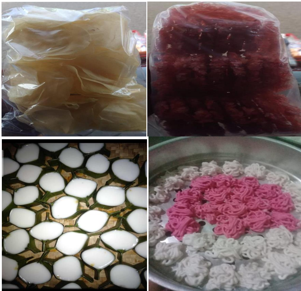
Gambar1. Hasil produk dari pelaku usaha