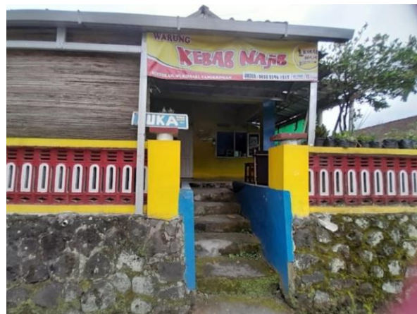
Gambar 1. Lokasi Pengabdian kepada Masyarakat