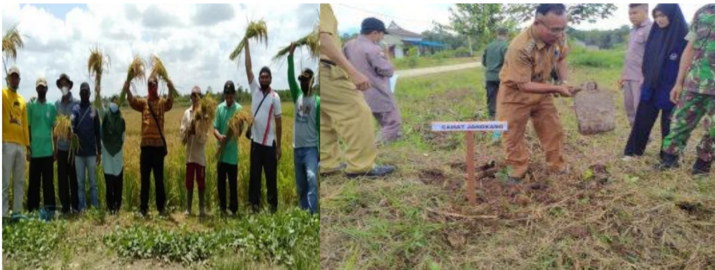
Gambar 1. Tanahnya termasuk dalam Ultisol dan Tanaman ubi rambat dan padi gogo, bisa menghasilkan di Desa Balai Sebut.

Kegiatan pertanian di Kecamatan Jangkang yang masih dilakukan secara konvensional dan belum maksimal dalam menggali potensi sumber daya yang ada serta belum banyak mengadopsi teknologi pertanian dalam pengelolaan pertanian untuk peningkatan hasil (Fitra et al. , 2021) sehingga melalui kegiatan pengabdian kepada masyarakat ini bertujuan untuk meningkatkan pengetahuan akan potensi desa yang dimiliki dan keterampilan mengadopsi teknologi pertanian secara teknis maupun ekonomi sehingga perekonomian dan pemberdayaan masyarakat semakin baik.