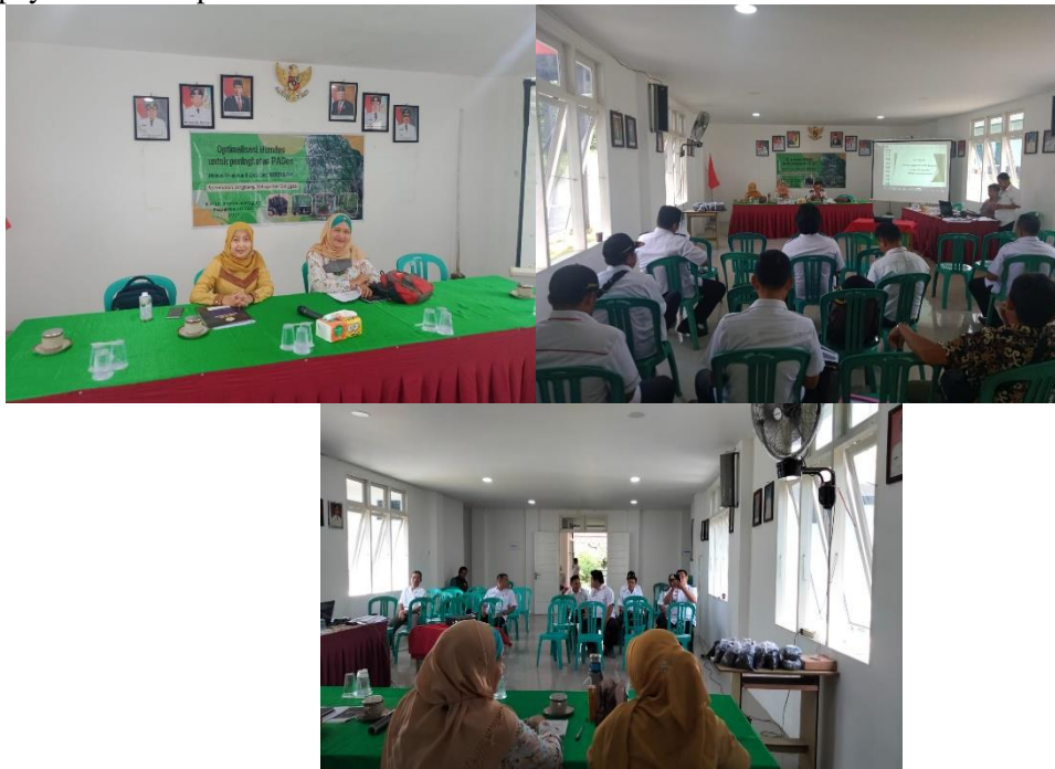
Gambar 2. Tim dosen, pelaksana PKM, PKM yang dihadiri oleh para Kepala Desa di Kabupaten Sanggau

Berdasarkan data BPS Kecamatan Jangkang tahun 2023, Dari 158.920 Ha lahan yang terdapat di Kecamatan Jangkang sekitar 2,74 persen merupakan lahan sawah, sekitar 57,21 persen merupakan lahan pertanian bukan sawah, dan sisanya sekitar 40,04 persen merupakan lahan bukan pertanian. Dari 4.360 Ha lahan sawah, sekitar 45,66 persen merupakan lahan sawah irigasi dan sekitar 54,33 persen merupakan lahan sawah tadah hujan. Komoditas tanaman hortikultura, pada Tahun 2022 Kecamatan Jangkang banyak menghasilkan duku/langsat/kokosan (mencapai 3.056 kuintal) dan durian mencaai 1283 kuintal. Sebagian besar tanaman perkebunan yang ditemui di Kecamatan Jangkang adalah tanaman karet dan kelapa sawit, dengan jumlah produksi masing-masing pada Tahun 2022 sebesar 6.750 ton dan 15.553 ton. Populasi ternak kecil yang paling banyak di Kecamatan Jangkang Tahun 2022 adalah babi, yaitu sebanyak 152 ekor. Populasi ternak besar didominasi oleh sapi biasa, yaitu 453 ekor. Populasi unggas yang paling banyak adalah ayam ras/ negeri yaitu sebanyak 42.500 ekor. Terdapat 280 unit kolam dan 36 unit karamba di Kecamatan Jangkang pada Tahun 2022. Produksi ikan nila mencapai 15.550 kg, ikan lele mencapai 23.650 kg.