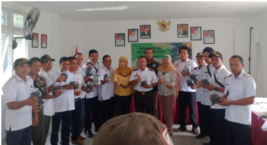
Gambar 6. Pembagian Teknologi Biochar kepada Kepala Desa di Desa Jangkang, Kabupaten Sanggau