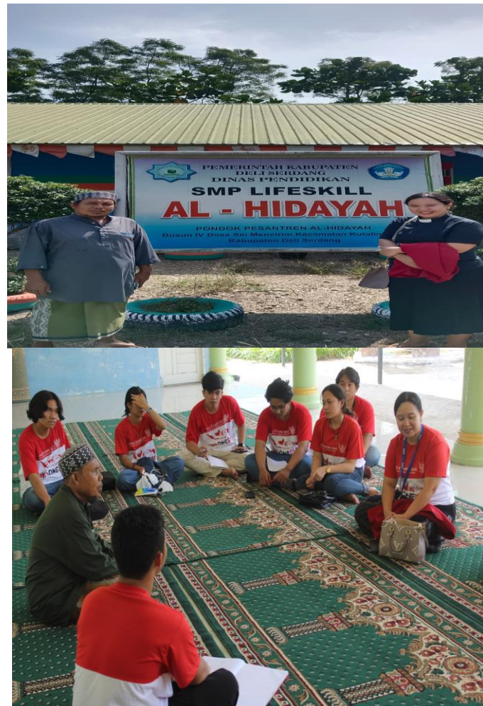
Gambar 3. Pesantren Al-Hidayah

Hal yang menonjol dalam kunjungan ke komunitas Budha ini adalah ketenangan dan juga kebersajahaan mereka. Ini point menarik bagi saya yang menjadi inspirasi dalam menjalin relasi antarumat beragama dalam mewujudkan Indonesia Damai.