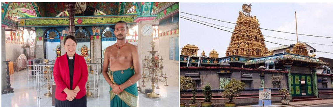
Gambar 1. Kuil Shri Mariamman, Medan

Hal lain yang membuat kunjungan lapangan ini menjadi penting bagi siswa adalah mereka dapat memahami dan mengapresiasi pengalaman tersebut, selanjutnya mereka dapat merefleksikan pengalaman ini. Refleksi ini diharapkan dapat berkembang menjadi aksi yang menjadi inspirasi dan motivasi mewujudkan Indonesia damai. Dalam tulisan ini, saya akan menguraikan tiga komunitas lintas agama yang kami kunjungi di daerah Medan, Sumatera Utara (Panggabean and Sagala 2021).