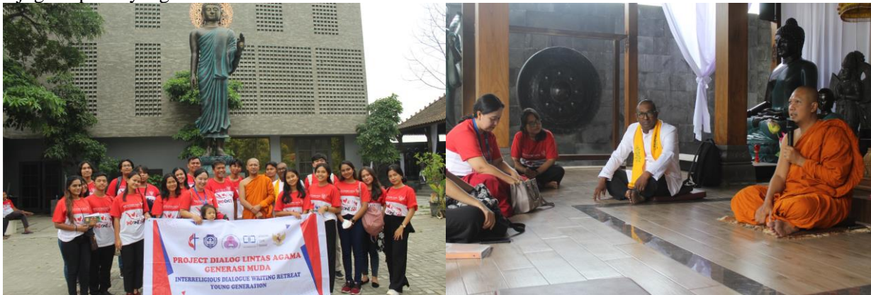
Gambar 2. Pubbarama Buddhist Centre

Di langit-langit kuil kita akan melihat ukiran yang beragam gambar dan corak menambah semakin indah nya Kuil Shri Mariamman. Setiap patung dewa yang ada di dalam Kuil Shri Mariamman ini mempunyai cerita tersendiri. Dalam kunjungan ini saya mendapati bahwa relief-relief dalam kuil ini memberikan symbol berharga yang menginspirasi bagaimana manusia memiliki keselarasan dengan alam dan juga ciptaan yang lain.