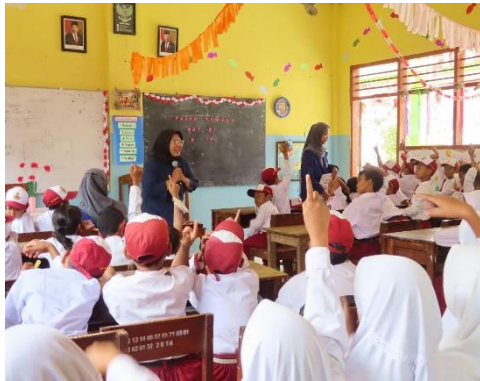
Gambar 5. Antusiasme peserta selama sesi implementasi

Mencatat keluar masuknya uang memang menjadi hal yang tabu bagi anak. Tetapi sangat penting untuk memberikan informasi kepada peserta tentang pentingnya pencatatan keuangan sehingga peserta memiliki bekal di masa depan. Penggunaan media kertas atau buku dapat digunakan oleh anak-anak untuk belajar bagaimana caranya menghitung pengeluaran dan pemasukan keuangannya. Penghasilan utama anak-anak berasal dari uang saku dari orang tuanya. Penghasilan tambahan biasanya diperoleh melalui pemberian dari anggota keluarga lain seperti kakek nenek, paman atau bibi. Anak-anak juga bisa mendapatkan uang tambahan dengan membantu anggota keluarganya mengerjakan pekerjaan rumah ataupun dengan mendorong anak-anak belajar mengenai kewirausahaan sejak dini. Bentuk kewirausahaan yang dapat dilakukan anak-anak seperti berjualan makanan ringan. Keuntungan penjualan nantinya dapat ditabung atau digunakan untuk memenuhi kebutuhan anak.