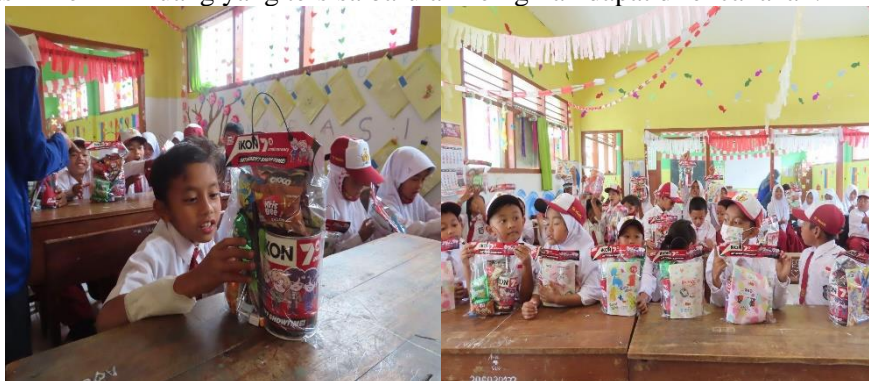
Gambar 4. Pemberian cinderamata berupa celengan, alat tulis, dan makanan ringan

Tim pengabdian memberikan penjelasan mengenai apa yang dimaksud dengan kebutuhan sesuai dengan kalimat sederhana anak SD. Kebutuhan yang dimaksud adalah pemenuhan dalam rangka misal kebutuhan dikemudian hari misal keperluan sekolah (Noor et al., 2023). Akan tetapi tim pengabdian juga memberikan penjelasan bahwa hati-hati juga pada pemenuhan kebutuhan yang berlebihan karena nantinya dapat disebut dengan keinginan. Perkembangan ilmu pengetahuan dan teknologi dapat membawa kemudahan bagi masyarakat untuk memiliki sesuatu. Perubahan dan variasi produk juga mempengaruhi pilihan masyarakat. Adakalanya apa yang dipilih justru tidak sesuai dengan kondisi keuangannya, bahkan produk tersebut tidak memiliki manfaat. Itulah mengapa sangat penting untuk dapat membedakan antara kebutuhan dengan keinginan, serta lebih mendahulukan kebutuhan daripada keuangan bukan sebaliknya. Kebutuhan sehari-hari seperti makan dan minum, sandang, dan papan harus dipenuhi terlebih dahulu. Jika kebutuhan tersebut sudah terpenuhi dan masih memiliki uang yang tersisa barulah keinginan dapat direncanakan.