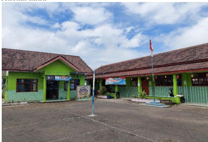
Gambar 1 SDN Duwet 1 Kabupaten Malang