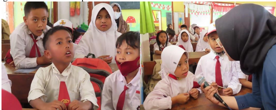
Gambar 6. Antusias peserta saat memberikan pertanyaan kepada pemateri

Kegiatan terakhir berupa implementasi yang dilakukan dengan peserta. Antusiasme tercermin dari beberapa pertanyaan yang dilontarkan mengenai kegiatan keuangan yang ingin mereka ketahui seperti bagaimana cara menabung? bagaimana cara menabung di bank?, bagaimana cara membeli sepeda?, apakah uang yang disimpan di Bank bisa hilang? bagaimana bank mencatat uang yang disimpan?, dan bagaimana cara mengambil uang di Bank?. Pertanyaan tersebut merupakan bukti bahwa peserta sangat antusias selama kegiatan pengabdian masyarakat diberikan. Pertanyaan yang tersirat inilah membuktikan bahwa ada keinginan anak untuk cakap literasi finansial.