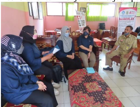
Gambar 2. Tim Pengabdian dan Kepala Sekolah SDN 1 Duwet

Kegiatan pengabdian masyarakat dilakukan di SDN 1 Duwet yang bertempat di JL. Tosari, Desa, Rt. 27 Rw. 9, Desa Duwet Kecamatan Tumpang Kabupaten Malang. Peserta merupakan siswa-siswa sekolah dasar kelas 4. Peserta sebanyak 60 siswa yang merupakan keseluruhan siswa SDN 1 Duwet. Pelaksanaan kegiatan dibagi menjadi dua tahap yaitu penyampaian materi dan implementasi. Sebelum penyampaian materi tim melakukan koordinasi dengan pihak sekolah untuk menjelaskan tujuan pengabdian.