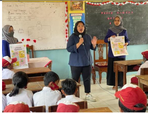
Gambar 3. Penjelasan materi menggunakan media poster

Anak-anak harus diajarkan bahwa dalam memperoleh sesuatu harus melihat kemampuan dari uang yang dimiliki, oleh karena itu penting bagi peserta untuk mengenal perencanaan keuangan. Perencanaan keuangan adalah tahapan awal untuk mengelola keuangan dimana agar seseorang memiliki tujuan jelas sebelum melakukan sesuatu yang diinginkan (Yulfiwandi et al., 2022). Perencanaan keuangan dapat dilakukan oleh peserta dengan mencatat barang beserta harga barang ketika menginginkan sesuatu. Tujuan pencatatan tentunya untuk melatih anak membuat skala prioritas. Pada kegiatan mencatat anak dibiasakan untuk menulis daftar kebutuhan dan keinginan serta membiasakan untuk tidak menggunakan semua uang. Kebiasaan menyalakan uang yang dimiliki pada akhirnya bertujuan untuk menabung. Memang seharusnya menabung saat memiliki uang akan tetapi melatih anak harus tahap per tahap. Melatih mulai dari menyisihkan sisa uang apabila sudah menjadi kebiasaan akan memberikan dampak positif juga.