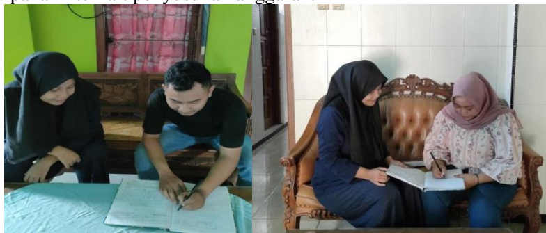
Gambar 4. Kegiatan Pelatihan