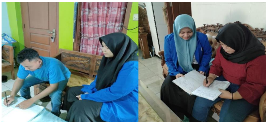
Gambar 5. Kegiatan evaluasi

Setelah tahap pelatihan kemudian pelaku usaha diberikan 10 soal post test untuk perubahan sebelum pelatihan dan setelah pelatihan. Soal post test berisi soal yang sama dengan soal yang diberikan pada pre test.