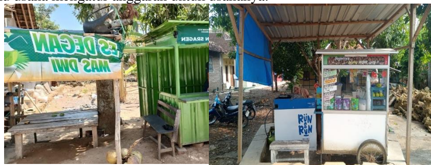
Gambar 3. Lokasi UMKM

Tahap survey meliputi mengumpulkan informasi serta data untuk mengetahui kemampuan pelaku usaha untuk mengembangkan bisnisnya, dan berapa tahun bisnis itu telah dimulai. Pada tahap ini juga bermaksud untuk meminta izin untuk melaksanakan kegiatan pengabdian. Sedangkan pada tahap wawancara, dilakukan tanya jawab guna menanyakan masalah yang dialami oleh dua usaha objek pengabdian, dan menanyakan sejauh mana pelaku usaha mengatur anggaran untuk usahanya.