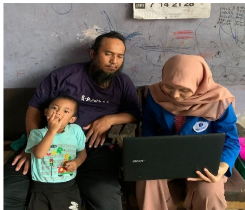
Gambar 2. Kegiatan pendampingan dan diskusi bersama mitra UMKM

Kegiatan ini dilakukan pada tanggal 13 September 2023. Pendampingan dan diskusi ini dilakukan secara dua arah kepada pelaku UMKM. Para pelaku UMKM mengikuti dan menyimak dengan antusias terhadap pendampingan pembukuan digital yang mana akan diberikan kesempatan untuk mempraktikkan secara langsung. Dalam digitalisasi penyusunan laporan keuangan pada pengabdian ini penyusunan laporan keuangan mengacu pada SAK EMKM yang tersusun atas bagian yaitu laporan posisi keuangan, laporan laba rugi, serta catatan atas laporan keuangan. Standar Akuntansi Keuangan Entitas Mikro, Kecil, dan Menengah (SAK EMKM) telah dirancang dan disahkan oleh Dewan Standar Akuntansi Indonesia guna meningkatkan akuntabilitas pelaporan keuangan yang dapat diandalkan sekaligus membantu mendorong pertumbuhan UMKM yang ada di Indonesia yang telah diberlakukan sejak tanggal 1 Januari tahun 2018 (Muhammad Aldi Firmansyah, 2018).