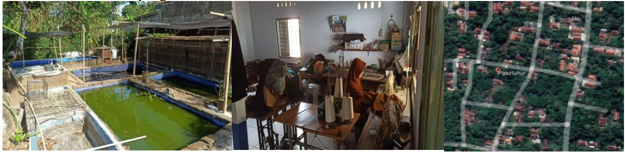
Gambar 1 Lokasi Pengabdian UMKM Ternak Ikan dan UMKM Jahit di Desa Majir