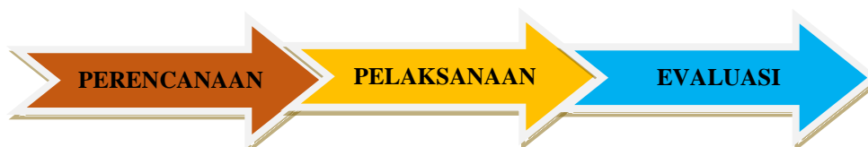
Gambar 2. Tahap-tahap Pengabdian