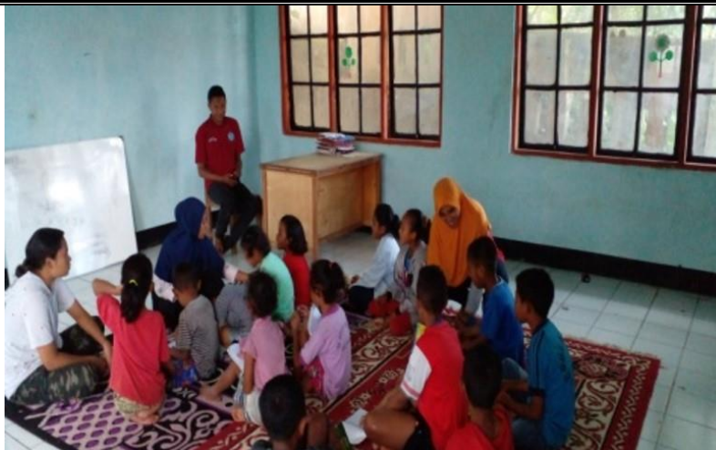
Gambar 3. Dokumentasi saat Pelaksanaan Bimbingan Belajar