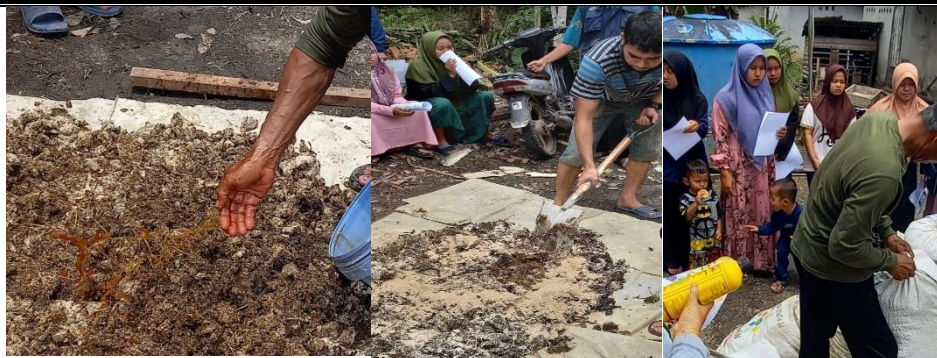
Gambar 2. Proses Pembuatan Pupuk Organik Kotoran Sapi

Pemupukan bertujuan untuk mempertahankan atau meningkatkan kesuburan tanah agar tanaman tumbuh lebih cepat, lebih produktif, dan lebih sehat (Agustine, Ramadhan and Manurung, 2022). Pemberian pupuk organik akan memperbaiki sifat kimia tanah (ketersediaan hara makro dan mikro), sifat biologi tanah (kaya mikro organisme) dan sifat fisika tanah (tanah menjadi gembur), dan secara langsung dapat meningkatkan produksi tanaman padi ataupun hortikultur (Agustine et al. , 2023). Salah satu contoh pupuk organik yaitu yang terbuat dari kotoran hewan ternak.