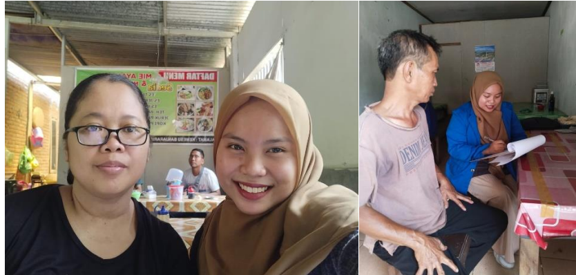
Gambar 3. Pelaksanaan Kegiatan Pengabdian

suatu usaha. Penyusunan laporan keuangan penting bagi usaha dikarenakan banyaknya manfaat yang diberikan bagi usaha. Laporan keuangan dapat mempermudah pelaku usaha untuk mengetahui kondisi dan kinerja keuangan usaha yang dijalankan karena adanya transparansi dari keuangan. Laporan keuangan juga dapat digunakan sebagai acuan dalam pengambilan keputusan bagi usaha kedepannya. Laba rugi yang dihasilkan pun menjadi jelas, sehingga pelaku usaha mengetahui secara pasti keuntungan maupun kerugian usaha yang berjalan. Selain itu, adanya laporan keuangan pada usaha dapat mempermudah pelaku usaha dalam mendapatkan bantuan modal untuk mengembangkan usahanya dengan mengajukan peminjaman ke bank ataupun menggunakan laporan keuangan sebagai alat untuk menarik investor agar bersedia berinvestasi.