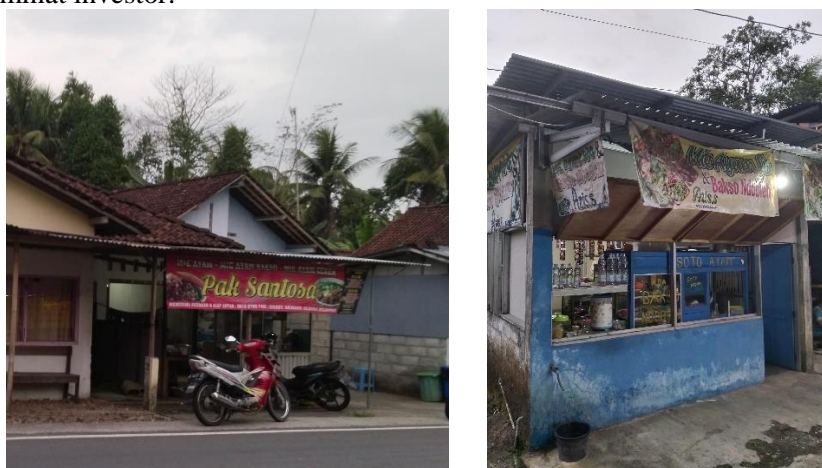
Gambar 1. Lokasi Pengabdian

UMKM sebagai salah satu sektor bisnis yang mengalami pertumbuhan yang pesat, namun hanya sebagian kecil dari UMKM yang mampu berkembang, khususnya dalam kinerja keuangannya. Pelaku usaha UMKM menganggap bahwa melakukan pembukuan dan penyusunan laporan keuangan merupakan hal yang cukup sulit juga memakan waktu serta biaya yang tidak sedikit, sehingga masih belum adanya pembukuan dan penyusunan laporan keuangan pada usaha yang dijalankan. Berkaitan dengan hal tersebut, dilakukan pengabdian dengan melakukan pelatihan pembukuan dan penyusunan laporan keuangan sederhana pada pelaku usaha UMKM. Tujuan dari pelatihan tersebut tidak lain agar pelaku usaha UMKM mampu mengelola keuangannya serta mengetahui kinerja keuangan dan kondisi usaha yang sedang dijalankan. Laporan keuangan juga dapat digunakan sebagai acuan dalam pengambilan keputusan. Laporan keuangan yang telah disusun juga dapat digunakan sebagai alat untuk mencari tambahan bantuan modal dengan mengajukan ke bank maupun menarik minat investor.