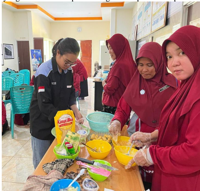
Gambar 2. Pembuatan nugget ikan

Sosialisasi dan pelatihan pada kegiatan pengabdian dilakukan pada 10 September 2023 dihadiri oleh perwakilan isteri nelayan, ibu-ibu PKK, ibu-ibu perangkat desa, dan pelaku usaha makanan sejumlah 15 orang. Acara dibuka oleh Kepala Desa Sambora dilanjutkan dengan pemberian kuisisioner tentang pengetahuan pembuatan patty dan nugget ikan. Selanjutnya dilakukan penyuluhan oleh Tim PKM dan dilanjutkan dengan praktek patty dan nugget ikan. Selain penyuluhan peserta juga diberikan pelatihan agar dapat meningkatkan keterampilan peserta (Harding & Diadiyono, 2018). Materi penyuluhan yang disampaikan terkait Teknik pembuatan patty dan nugget ikan, mulai dari persiapan alat dan bahan. Pelaksanaan kegiatan sosialisasi dan pelatihan yang dilakukan dan peserta kegiatan dapat dilihat pada Gambar 2.