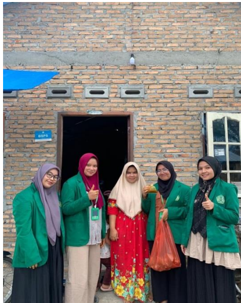
Gambar 1. Pendistribusian Jamu Kepada Warga Dusun 1 Desa Pematang

Menyampaikan hasil temuan saintifik secara jelas dan dapat dipahami kepada masyarakat setempat untuk meningkatkan pemahaman mereka terhadap manfaat dan potensi risiko konsumsi minuman jamu tradisional.