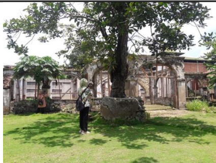
Gambar 1. Lokasi PKM