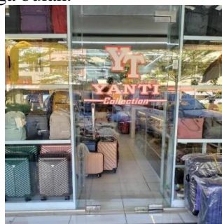
Gambar 2. Lokasi UMKM

Ruang lingkup dari proyek yaitu penyusunan peraturan kerja pada UMKM Yanti Collection agar dapat mengelola kinerja karyawan, memberikan arahan kepada karyawan agar tujuan UMKM dapat tercapai, membantu UMKM agar dapat meningkatkan kualitas karyawan, membangun kenyamanan dalam lingkungan kerja, dan menciptakan sikap profesionalisme dalam bekerja. Pelaksanaan pengabdian masyarakat akan dilakukan dalam jangka waktu selama tiga bulan.