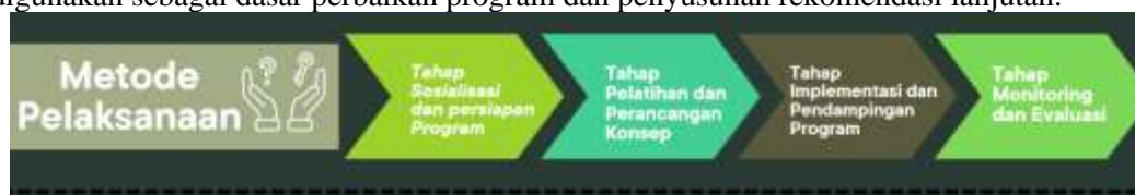
Gambar 2. Metode Pelaksanaan

Monitoring dan evaluasi dilakukan untuk menilai keberhasilan program yang telah dilaksanakan. Evaluasi mencakup aspek pengelolaan embong, pemahaman masyarakat terhadap konsep wisata, efektivitas identitas yang dibangun, serta dampak pemasaran digital terhadap tingkat kunjungan dan minat masyarakat. Hasil evaluasi digunakan sebagai dasar perbaikan program dan penyusunan rekomendasi lanjutan.