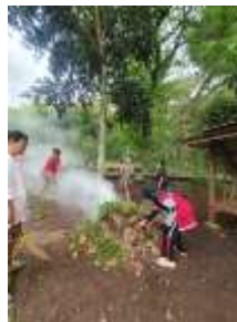
Gambar 4. Peningkatan partisipasi warga dalam kerja bakti embung

Namun demikian, kegiatan ini menunjukkan pendekatan yang berbeda dibandingkan penelitian sebelumnya. Penelitian ini lebih menitikberatkan pada pembangunan infrastruktur fisik wisata, kegiatan ini lebih menekankan pada penguatan aspek sosial melalui pemberdayaan masyarakat dan pengembangan branding digital. Pendekatan ini terbukti mampu meningkatkan rasa memiliki masyarakat terhadap pengembangan wisata embung, yang terlihat dari meningkatnya partisipasi warga dalam kegiatan kerja bakti dan pengelolaan media promosi wisata (Gambar 4).