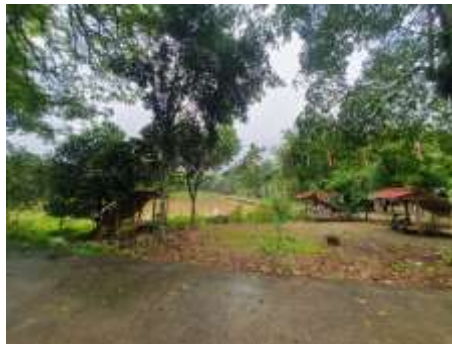
Gambar 1. Situasi Embong Desa Krandegan

Berdasarkan hasil observasi dan survei yang dilakukan di Desa Krandegan, khususnya pada sektor pengelolaan wisata embong, ditemukan beberapa permasalahan yang menghambat optimalisasi potensi desa.