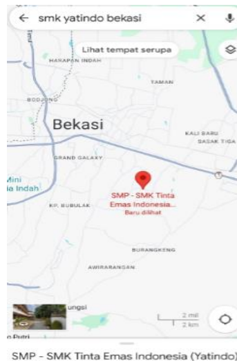
Gambar 1. Lokasi PKM

Permasalahan yang dihadapi oleh mitra adalah kurangnya pengenalan dan pengetahuan perhitungan pajak penghasilan orang pribadi itu sendiri. Mitra, yang merupakan di siswa/siswi, menyatakan bahwa mereka kesulitan dalam memaparkan materi terkait perpajakan terlebih pajak penghasilan orang pribadi karena belum terlalu mengenal tentang perhitungan pajak penghasilan orang pribadi. Oleh sebab itu, Mitra dalam Pelatihan ini mengharapkan untuk dapat diberikan materi Pelatihan Perhitungan Pajak Penghasilan Orang Pribadi.