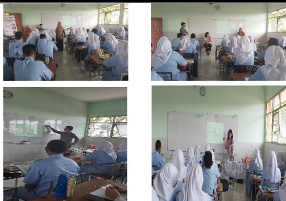
Gambar 2. Kegiatan Pelatihan Perhitungan Pajak Orang Pribadi Di Smk Yatindo Kota Bekasi