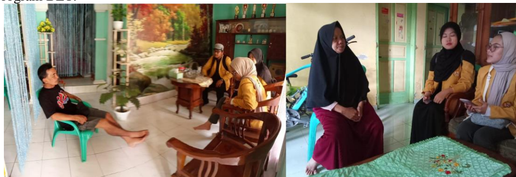
Gambar 1. Wawancara Masyarakat

Berdasarkan pengamatan di lapangan, masih banyak kelemahan dalam pengelolaan dana BLT tersebut, terutama dalam proses penyalurannya, sehingga membawa dampak berupa ketidakpuasan rakyat akan hasil dari model penyaluran yang digunakan. Oleh karena itu, penting untuk mengetahui persepsi masyarakat terhadap program BLT.