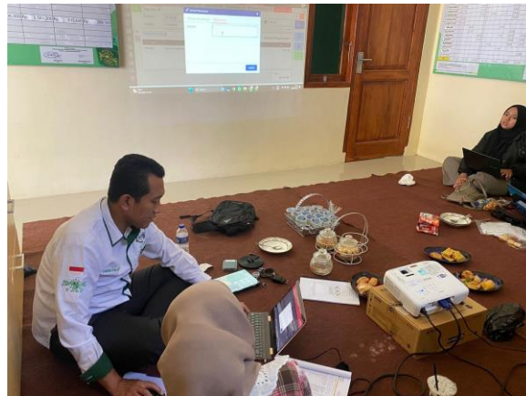
Gambar 1. Tahap Persiapan Pengabdian dan Diskusi Interaktif