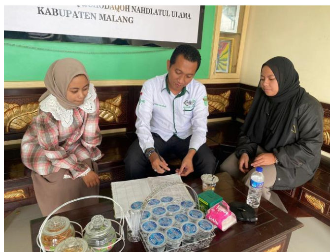
Gambar 2. Tahap Pelaksanaan Pengabdian (Brainstorming)

Brainstorming bertujuan memberikan pemahaman kepada pengurus LAZISNU Kabupaten Malang terkait kebijakan yang telah dirumuskan. Tim pengabdian melakukan brainstorming dengan pengurus LAZISNU Kabupaten Malang sebanyak 3 kali. Brainstorming pertama dilaksanakan pada tanggal 9 September 2023 secara online melalui platform google meet. Brainstorming ini dihadiri oleh semua penguus LAZISNU dan tim pengabdian, Brainstorming kedua dilaksanakan pada tanggal 10 September 2023 secara offline yang bertempat di Kantor LAZISNU Kabupaten Malang. Brainstorming ini dihadiri oleh staf keuangan LAZISNU. Sedangkan Brainstorming ketiga dilaksanakan pada tanggal 16 September 2023 bertempat di Kantor LAZISNU Kabupaten Malang. Brainstorming ini membahas tentang regulasi pencatatan dan penginputan transaksi keuangan serta penyaluran dana infak, zakat dan sedekah. Berikut ini merupakan dokumentasi dari pelaksanaan brainstorming: