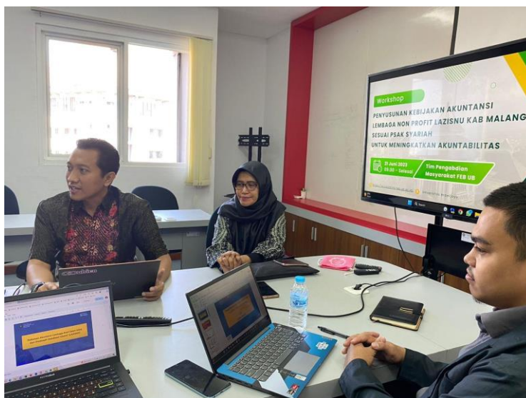
Gambar 3. Seminar Penerapan Kebijakan Akuntansi

Berikut ini merupakan dokumentasi kegiatan seminar penerapan kebijakan akuntansi: