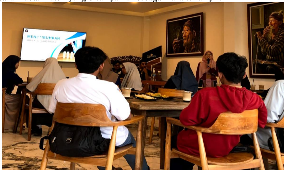
Gambar 1. Dokumentasi Kegiatan Pelatihan Peningkatan Jiwa Wirausaha