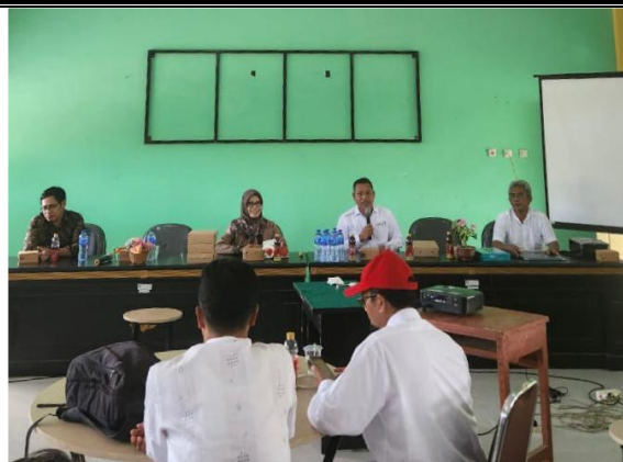
Gambar 4. Rencana Strategis BLUD dan Standar Pelayanan Minimal BLUD

Dalam rangka penerapan BLUD untuk meningkatkan kualitas pendidikan SMK, maka tim pengabdian memberikan materi ke-empat dengan judul kegiatan adalah “Laporan Keuangan BLUD”. Tujuan dari laporan keuangan BLUD adalah menyajikan informasi mengenai posisi keuangan, realisasi anggaran, saldo anggaran lebih, arus kas, hasil operasi, dan perubahan ekuitas BLUD yang bermanfaat bagi para pengguna dalam membuat dan mengevaluasi keputusan mengenai alokasi sumber daya. Secara spesifik, tujuan pelaporan keuangan BLUD adalah untuk menyajikan informasi yang berguna dalam pengambilan keputusan dan untuk menunjukkan akuntabilitas entitas pelaporan atas sumber daya yang dimiliki. Sesi ini berlangsung selama 90 menit, dimana pemateri memberikan arahan kepada mitra pengabdian untuk mencoba dan menganalisa kasus laporan keuangan BLUD di SMK. Setelah sesi ini selesai, mitra pengabdian diberikan waktu selama 30 menit untuk sesi tanya jawab (metode Diskusi) kepada pemateri.