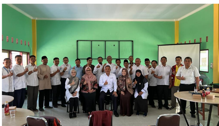
Gambar 2. Persiapan Pelatihan untuk Implementasi BLUD

Dalam pelaksanaan pengabdian yang berjudul “Pelatihan Persiapan Penerapan BLUD (Badan Layanan Umum Daerah) untuk SMK (Sekolah Menengah Kejuruan) di Lombok, Nusa Tenggara Barat (NTB)” dilakukan secara langsung dengan didampingi dan diawasi oleh mitra pengabdian, yaitu Dinas Pendidikan dan Kebudayaan (Dikbud) NTB (Nusa Tenggara Barat). Kegiatan pengabdian kali ini telah dilakukan dengan meliputi beberapa tahap kegiatan yang tercakup pada tahap persiapan dan tahap pelaksanaan. Tim pengabdian melakukan peninjauan lapang sebagai tahap awal persiapan kegiatan di SMKN 3 Selong yang bertujuan untuk melakukan identifikasi dan menggali informasi pokok permasalahan yang dialami oleh Kepala Sekolah SMK dalam penerapan BLUD di SMK, serta penyusunan konsep kegiatan pelatihan apa yang sesuai untuk menjawab permasalahan yang di alami oleh mitra pengabdian.