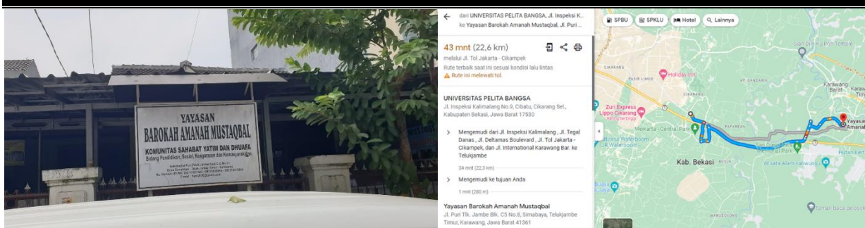
Gambar 1. Lokasi Pengabdian Kepada Masyarakat

5R merupakan kegiatan yang bertujuan untuk menjaga kebersihan kerapihan agar senantiasa terawat dengan baik. Berikut gambar penyimpanan buku-buku dan dokumen yang terlihat tidak rapi karena hanya menumpuk begitu saja. Kondisi seperti gambar di bawah merupakan kondisi di mana 5R belum dilakukan sehingga penyimpanan buku dan dokumen hanya ditumpuk. Jika 5R tidak dilakukan maka tumpukan buku atau dokumen akan terus bertambah. Gambar 2 merupakan kondisi penyimpanan buku dan dokumen yang perlu dibenahi.