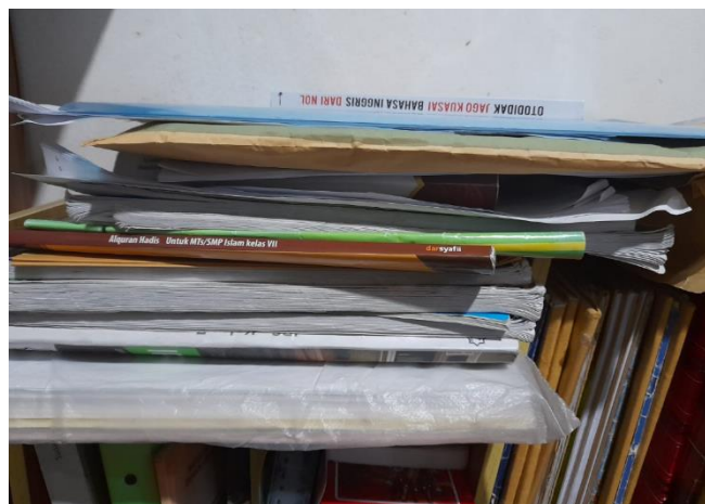
Gambar 2. Penyimpanan dokumen dan Buku

5R merupakan kegiatan yang bertujuan untuk menjaga kebersihan kerapihan agar senantiasa terawat dengan baik. Berikut gambar penyimpanan buku-buku dan dokumen yang terlihat tidak rapi karena hanya menumpuk begitu saja. Kondisi seperti gambar di bawah merupakan kondisi di mana 5R belum dilakukan sehingga penyimpanan buku dan dokumen hanya ditumpuk. Jika 5R tidak dilakukan maka tumpukan buku atau dokumen akan terus bertambah. Gambar 2 merupakan kondisi penyimpanan buku dan dokumen yang perlu dibenahi.