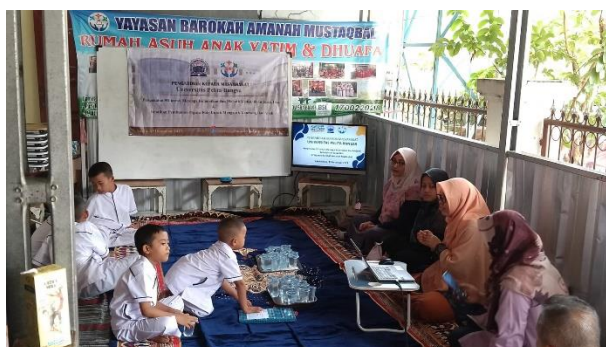
Gambar 3. Pemaparan Materi 5R

R1 adalah ringkas dengan memberikan penjelasan arti dari ringkas adalah melakukan pemilahan dan memisahkan barang-barang yang tidak diperlukan, R2 adalah Rapih dengan memberikan penjelasan tahap ini merupakan tahap penataan, R3 adalah resik merupakan tahap untuk selalu menjaga kebersihan di lingkungan sekitar, R4 adalah rawat pada tahap ini perlu dipertahankan kegiatan R1, R2 dan R3 sehingga kondisi lingkungan terus terlihat rapih, tersusun dengan baik dan R5 adalah rajin dengan kebiasaan yang sudah menjadi budaya untuk terus menjaga agar kondisi lingkungan selalu terlihat ringkas, rapih, dan resik serta terawat dengan baik. Setelah penjelasan keseluruhan dari 5R anak-anak memahami dan mengerti 5R. Pemahaman 5R perlu penjelasan secara konkrit dan hasil akan tampak ketika ada pertanyaan di akhir sesi pemaparan (Iqbal et al., 2023). Gambar 3 saat penyampaian dan penjelasan secara konkrit definisi 5R dengan menyisipkan pertanyaan kegiatan 5R sehari-hari yang dilakukan. Hasil akhir dari pengabdian rata-rata peserta memahami 5R dan masing-masing kegiatan di dalamnya dan dapat menerapkan dengan baik meskipun belum 100% peserta memahami 5R secara lengkap namun peningkatan cukup signifikan dari sebelum dan sesudah diberi penjelasan dan contoh aktivitas 5R, rata-rata dari keseluruhan item kegiatan dan jumlah peserta meningkat sebesar 79%.