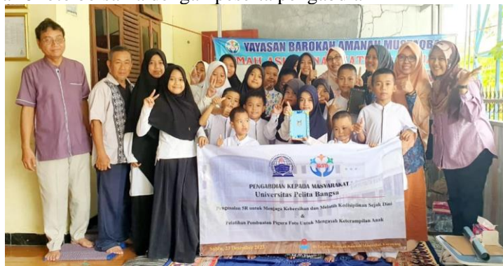
Gambar 6. Foto Bersama Peserta Pengabdian

Di sesi akhir pengabdian peserta dan team PKM (Pengabdian Kepada Masyarakat) melakukan foto Bersama. Berikut gambar 6 foto bersama dengan peserta pengabdian