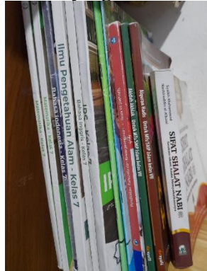
Gambar 5. Penataan dan Standarisasi

Sedangkan gambar 5 merupakan penyimpanan setelah proses pemilahan yang merupakan proses penataan dan perapihan serta selalu menjaga kebersihan dan terus merawat penyimpanan dengan baik supaya terus tertata dengan rapih sehingga buku atau dokumen yang dibutuhkan segera dapat ditemukan