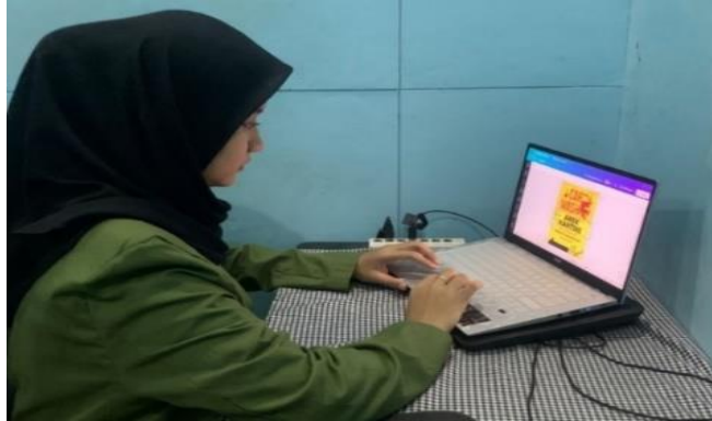
Gambar 4. Proses Pembuatan Spanduk

Tahapan berikutnya adalah proses pembuatan spanduk untuk usaha pencucian mobil “Arek Kartini” di Penjaringan Sari Surabaya yang tujuannya untuk meningkatkan brand image di mata masyarakat. Seperti yang diketahui citra merek dapat mempengaruhi reputasi dan kredibilitas masyarakat terhadap suatu merek. Desain spanduk sudah ditentukan konsep yang akan digunakan. Tulisan dan latar spanduk menggunakan warna cerah dengan tujuan dapat menarik masyarakat dari jarak jauh. Proses pembuatan spanduk ini dilakukan di usaha pencucian mobil yang berada di Penjaringan Sari Surabaya.