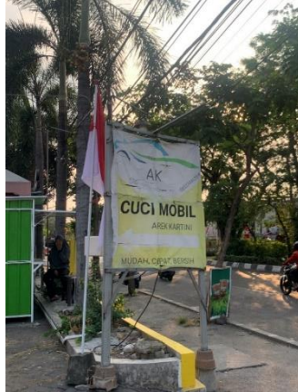
Gambar 1. Desain Spanduk Lama

usaha. Oleh karena itu, diperlukan pemanfaatan platform online untuk meningkatkan penjualan. Selain itu, tujuan dari pembuatan platform online adalah untuk memperluas jangkauan pasar sehingga usaha pencucian mobil di Penjaringan Sari Surabaya dikenal oleh banyak orang.