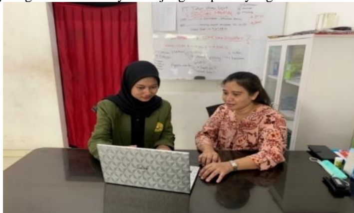
Gambar 5. Diskusi Hasil Design Spanduk

Setelah selesai tahap pembuatan spanduk, dilakukan diskusi terhadap desain spanduk yang sudah jadi dengan manajer usaha pencucian mobil. Evaluasi dilakukan untuk mengetahui kekurangan terhadap desain spanduk yang baru untuk usaha pencucian mobil di Penjaringan Sari Surabaya. Setelah berdiskusi panjang, manajer usaha pencucian mobil telah menyetujui desain spanduk yang dibuat dan desain spanduk yang baru siap untuk diserahkan dan dipasang. Hasil dari branding spanduk ini membuat usaha pencucian mobil di Penjaringan Sari Surabaya dapat bersaing secara lebih efektif di pasar. Hal ini juga memungkinkan usaha pencucian mobil di Penjaringan Sari Surabaya menjangkau pasar yang lebih luas.