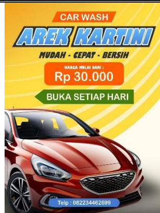
Gambar 7. Design Spanduk Baru