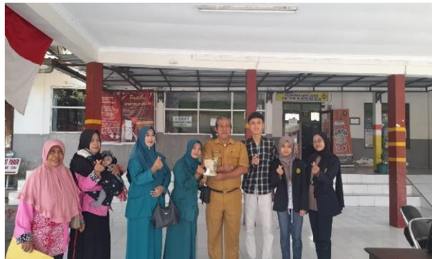
Gambar 8. Monitoring Akhir Kerupuk Tape dengan Ibu-Ibu PKK