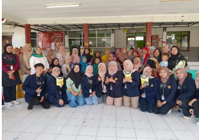
Gambar 3. Kegiatan Pra Sosialisasi Pembuatan Produk Kerupuk Tape