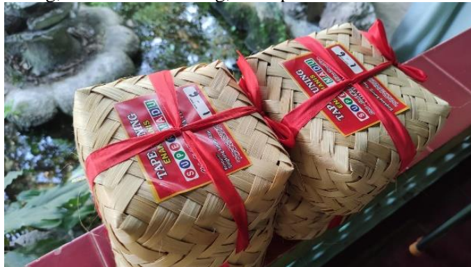
Gambar 2. Tape sebagai Bahan Dasar Pembuatan Produk Diversifikasi

Perlu adanya persiapan sebelum melaksanakan sosialisasi untuk memastikan semua kebutuhan selama pelaksanaan dapat dipersiapkan dengan baik, sehingga kegiatan dapat berjalan dengan lancar dan mencapai tujuan yang diinginkan. Proses persiapan dan perencanaan dimulai dengan pemilihan mitra, yang dilakukan berdasarkan ketersediaan tenaga kerja dan kesediaannya untuk menjadi mitra. Mitra dipilih karena dianggap mampu dalam melakukan kerja sama. Diharapkan peningkatan produksi olahan dapat meningkatkan nilai jual dari produk tape itu sendiri. Pada tahap persiapan, tim pelaksana kegiatan sosialisasi melakukan beberapa langkah, termasuk menyiapkan peralatan dan bahan sebagai pendukung kegiatan, menyiapkan produk kerupuk tape yang akan disosialisasikan dan digunakan sebagai contoh, serta menyiapkan lokasi pelaksanaan kegiatan sosialisasi di Kelurahan Gebang, Kecamatan Patrang, Kabupaten Jember.