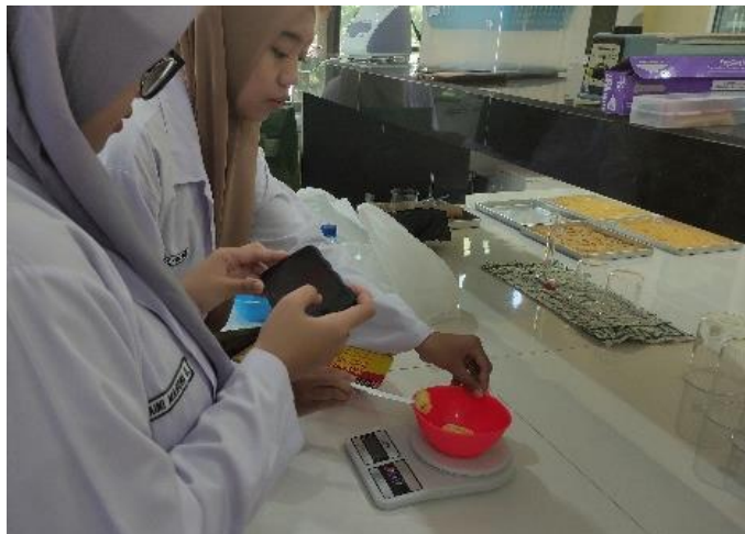
Gambar 4. Kegiatan Trial Pembuatan Kerupuk Tape di Laboratorium

Penggunaan tepung tapioka dan tepung terigu diatur dalam perbandingan 4:1, dengan proporsi tepung tapioka empat kali lipat dari tepung terigu (tapioka : terigu = 4:1). Tape yang digunakan dalam pembuatan kerupuk ini dipasok oleh UMKM Supermadu, yang memiliki peran sebagai mitra dalam program ini. Dengan demikian, proses pembuatan kerupuk tape singkong kuning ini melibatkan kerjasama dengan UMKM sebagai bagian dari inisiatif program.