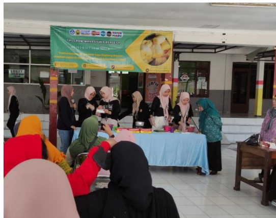
Gambar 6. Kegiatan Sosialisasi Pembuatan Kerupuk Tape Bersama dengan Ibu-Ibu PKK