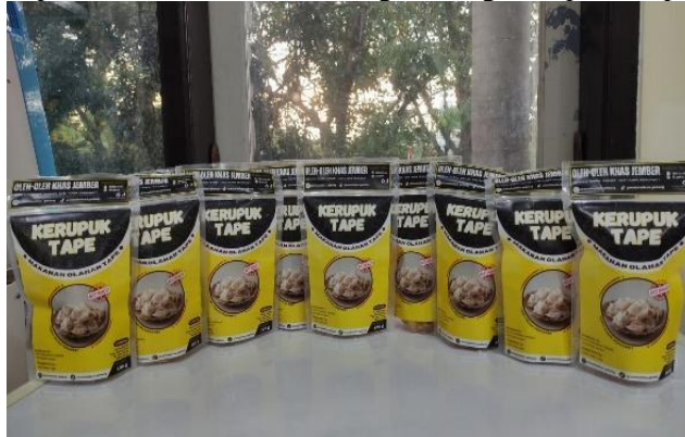
Gambar 7. Hasil Akhir Kerupuk Tape

Kerupuk yang telah dihasilkan berdasarkan hasil trial yang telah dilakukan menghasilkan kerupuk yang renyah dan memiliki dua varian rasa. Dengan varian rasa original yang cenderung manis dan varian rasa bawang putih yang cenderung gurih. Respon positif dari ibu-ibu PKK diperoleh untuk hasil akhir dari kegiatan sosialisasi pembuatan kerupuk tape ini. Setelah dilakukan kegiatan sosialisasi, pada minggu kedua dilakukan pemberian vandol sebagai ucapan terimakasih dan kenang-kenangan kepada bapak Lurah Kelurahan Gebang.