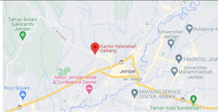
Gambar 1. Lokasi Sosialisasi Program Mahasiswa Berdesa