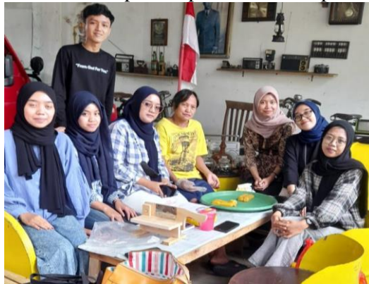
Gambar 5. Kegiatan Sosialisasi Pembuatan Produk Kerupuk Tape Bersama dengan Mitra

Pelaksanaan praktik pembuatan kerupuk tape singkong kuning secara langsung, dilakukan setelah penayangan video proses pembuatan. Antusiasme ibu – ibu PKK yang cukup besar dalam membuat kerupuk tape singkong kuning, sehingga pada proses praktik dapat berjalan dengan lancar. Secara keseluruhan, ibu-ibu PKK dapat mempraktikkan dan melaksanakan praktik pembuatan kerupuk tape dengan baik dan antusias.