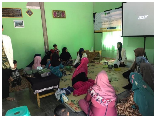
Gambar 3. Pemaparan dan Praktek Pembuatan Sabun

Sedangkan pelatihan pembuatan sabun berbahan dasar minyak jelantah dilakukan karena masih minimnya pengetahuan dan ketrampilan masyarakat dalam hal pemanfaatan sampah rumah tangga menjadi suatu produk yang memiliki nilai ekonomis yang lebih tinggi. Pelatihan ini diharapkan akan memunculkan semangat peserta untuk mencoba membuat sabun sendiri mengingat bahan – bahan dan peralatan yang digunakan ada di sekitar kita dan terjangkau.