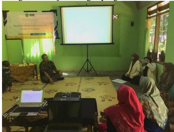
Gambar 2. Penyampaian Materi Pemanfaatan Sampah Rumah Tangga

meminimalkan penggunaan bahan yang bisa menambah sampah dengan metode 3R ( Reduce , Reuse dan Recycle ) ditambahkan pula kemampuan membaca peluang usaha dengan memanfaatkan sampah rumah tangga salah satunya minyak jelantah yang dijadikan bahan baku pembuatan sabun. Disampaikan pula dalam kesempatan tersebut beberapa barang hasil kerajinan tangan yang berbahan dasar sampah rumah tangga.