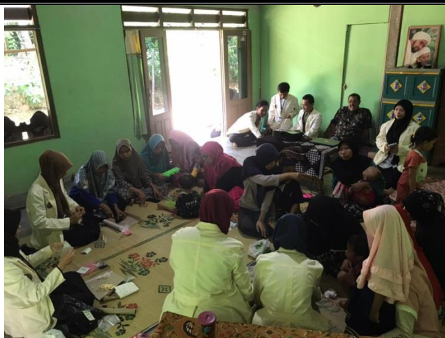
Gambar 4. Peserta Sedang Berlatih Pembuatan Sabun

Tahap akhir pengabdian pada masyarakat ini melalui program KKN-T 2024 telah dilaksanakan dengan penyusunan laporan kegiatan selama program dilaksanakan. Selain itu juga telah ditulis artikel pengabdian masyarakat untuk menyebarkan informasi tentang kegiatan yang telah dilaksanakan.