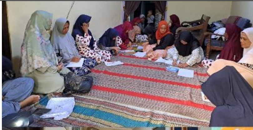
Gambar 3. Pendampingan manajemen keuangan keluarga Dasawisma Teratai

Selanjutnya yaitu pendampingan dalam mengelola keuangan keluarga. Dalam melaksanakan rencana pengeluaran yang telah disusun, mitra diajarkan untuk menggunakan sistem amplop. Hal ini disesuaikan dengan karakteristik mitra yang sebagian besar sudah berusia lanjut. Sistem amplop merupakan sistem pelaksanaan manajemen keuangan keluarga yang memanfaatkan amplop sebagai sarana pengelolaannya. Amplop sebagai tempat untuk menyimpan sementara uang kita sesuai dengan kebutuhan yang telah direncanakan. Jadi, uang dibagikan dalam amplop tertentu yang telah ditulis di bagian luarnya sesuai dengan jenis kebutuhan yang telah disepakati dalam anggaran rumah tangga. Artinya, jumlah amplop yang sesuai dengan jumlah kebutuhan telah direncanakan dan disepakati sebelumnya pada anggaran.