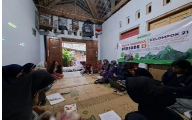
Gambar 2. Pelatihan Administrasi Keuangan Dasawisma Teratai