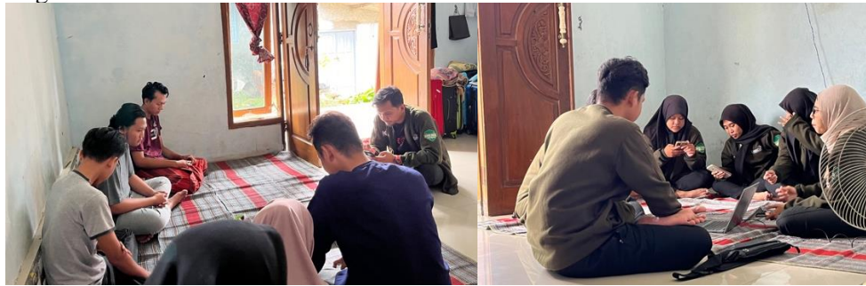
Gambar 3. Kegiatan Koordinasi

sebelumnya juga sebagai referensi untuk menyelesaikan permasalahan yang ada, terutama peningkatan kualitas lingkungan.