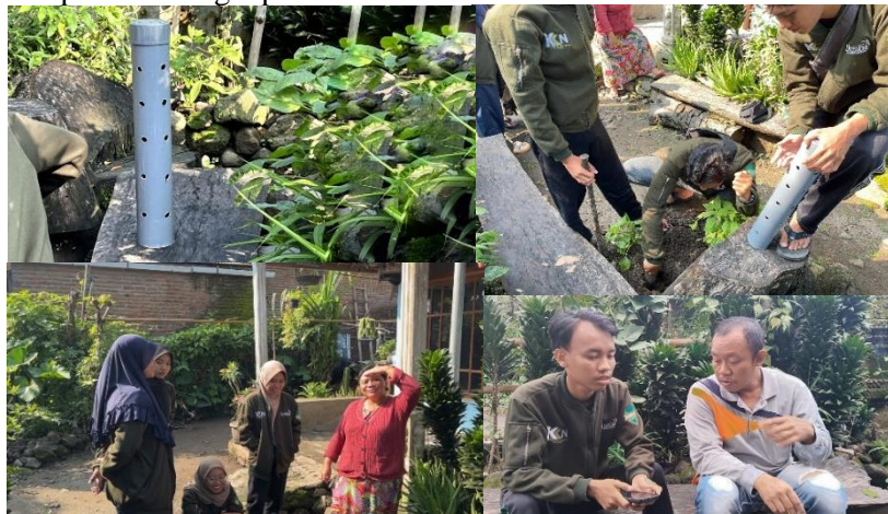
Gambar 5. Pemasangan Biopori serta mengedukasi warga

Dengan adanya kegiatan ini, warga Desa Kesimantengah dapat memaksimalkan penggunaan biopori sebagai alat untuk mengelola sampah organik menjadi pupuk kompos sehingga dapat dimanfaatkan oleh warga desa yang mayoritas berprofesi sebagai petani.