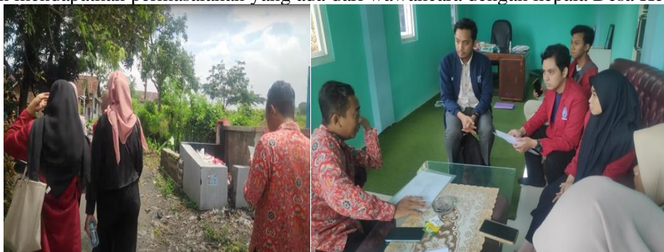
Gambar 2. Survei Lokasi

Kegiatan KKN yang dilakukan oleh mahasiswa adalah sebuah wadah dalam pengembangan pengetahuan yang berkaitan dengan kualitas lingkungan. Dimulai dari kunjungan lapangan untuk memahami kondisi lingkungan dan mendapatkan permasalahan yang ada dari wawancara dengan kepala Desa Kesimantengah.