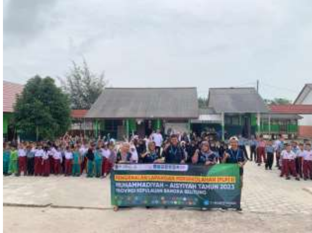
Gambar 1. Perkenalan dari Mahasiswa Kepada Para Guru dan siswa SDN 3 AIRGEGAS

Permukiman Pergam terletak di Bangka Belitung, kecamatan Airgegas, kabupaten Bangka Selatan. Pengetahuan hukum di masyarakat masih minim, khususnya terkait Perlindungan Anak yang diatur dalam Undang-Undang Nomor 35 Tahun 2014. Di SDN Airgegas 3, peneliti juga menemukan bukti adanya peristiwa perundungan yang melibatkan siswa saat jam istirahat makan siang dan jam istirahat. proses pembelajaran.