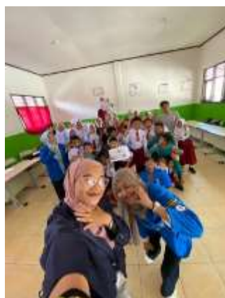
Gambar 2. Penyuluhan ke setiap kelas di SDN 3 AIRGEGAS

Instruksi hukum tentang keselamatan anak juga diberikan kepada para guru. Sesuai Pasal 1 Undang-Undang Nomor 23 Tahun 2002 tentang Perlindungan Anak, perlindungan anak mencakup segala upaya yang bertujuan untuk menjamin dan melindungi anak serta hak-haknya, memungkinkan mereka untuk hidup, tumbuh, berkembang, dan berpartisipasi semaksimal mungkin, sesuai dengan hak asasi manusia. Nilai-nilai dan martabat, Bagi siswa SDN 3 airgegas penyuluhan yang diberikan mengenai efek dari melakukan bullying dan bentuk bullying.