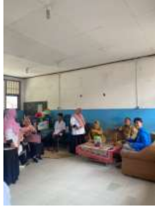
Gambar 3. Penyuluhan terhadap guru di SDN 3 AIRGEGAS