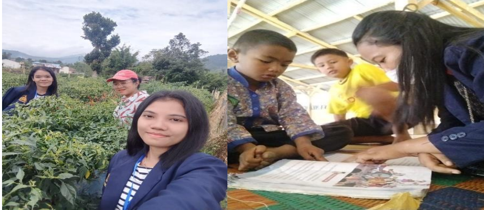
Gambar 2. Pelaksanaan Kegiatan