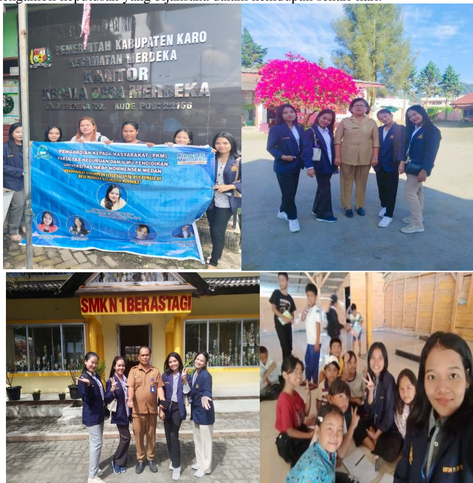
Gambar 1. Lokasi PkM dan Foto Bersama

Masalah yang terjadi pada anak dan remaja desa merdeka yaitu rendahnya kemampuan literasi anak dan remaja di desa Merdeka. Meningkatkan kemampuan literasi di kalangan anak-anak dan remaja sangat penting karena literasi adalah keterampilan kunci yang diperlukan untuk sukses dalam kehidupan modern. Di dunia yang semakin kompleks dan berubah dengan cepat, literasi tidak hanya berarti kemampuan membaca dan menulis, tetapi juga kemampuan untuk memahami, menganalisis, dan menggunakan informasi secara efektif. Pentingnya pendidikan literasi di dunia modern ini sangat penting. Literasi memungkinkan orang untuk memahami, menganalisis, dan menggunakan informasi secara efektif, yang merupakan keterampilan kunci untuk sukses di dunia yang semakin kompleks dan berubah cepat. Tanpa keterampilan literasi yang memadai, individu mungkin kesulitan dalam mencari pekerjaan, memanfaatkan peluang pendidikan, memahami masalah global, dan mengambil keputusan yang bijaksana dalam kehidupan sehari-hari.