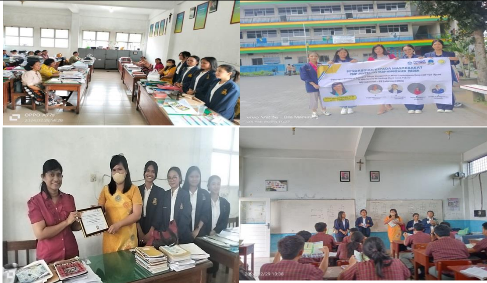
Gambar 1. Foto Kegiatan PkM