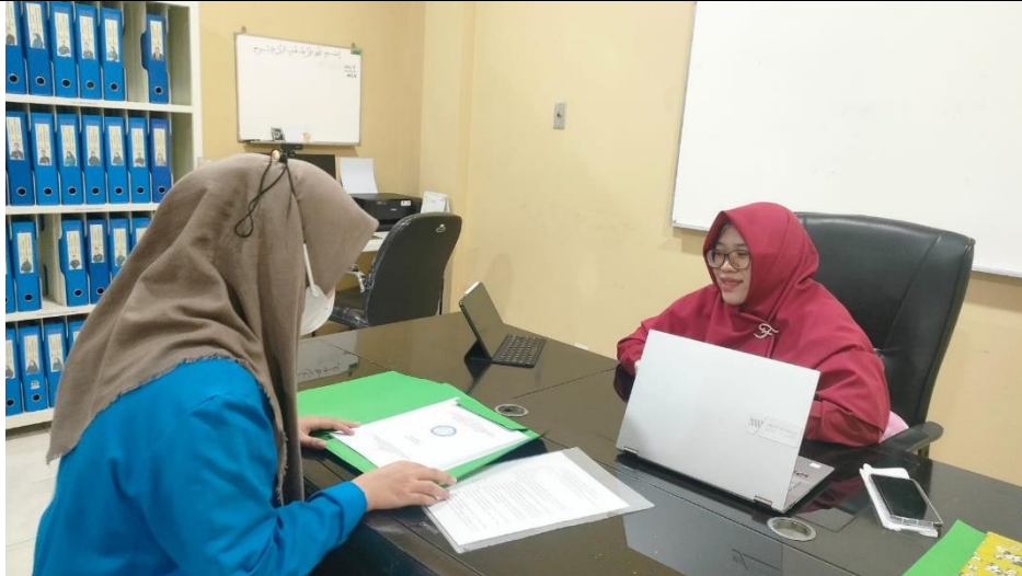
Gambar 2. Kegiatan Diskusi dengan Kepala Klinik Pratama Islamic Center

Berdasarkan hasil analisis masalah yang telah dilakukan, terdapat beberapa faktor yang menjadi sebab akibat dalam ketidaklengkapan alat kesehatan pada unit laboratorium dan poli pemeriksaan umum, dimana faktor tersebut terdiri dari :