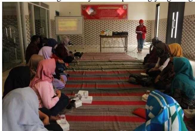
Gambar 1. Acara dimulai

Adapun hasil yang telah dicapai dalam pelaksanaan kegiatan program kreativitas mahasiswa “Pelatihan Pengolahan Pie Durian Sebagai Alternatif Produk Lokal” di Desa Jarak adalah agar masyarakat khususnya ibu-ibu PKK dapat mengetahui apa itu kue pie durian, bagaimana cara pembuatannya. Sehingga dalam jangka waktu panjang masyarakat dapat lebih kreatif lagi dalam menciptakan pie dengan varian baru dan rasa yang enak dengan tampilan yang menarik agar mampu bersaing dengan berbagai jenis kue yang diperjualbelikan di kota-kota besar. Pada pelatihan pengolahan ini ibu-ibu PKK Desa Jarak terlihat begitu antusias saat mengikuti pelatihan yang diberikan, sehingga sebagian besar dari mereka mulai memahami tentang bagaimana cara pembuatan pie durian. Hal ini terbukti dengan adanya beberapa orang yang mengikuti pelatihan ini.