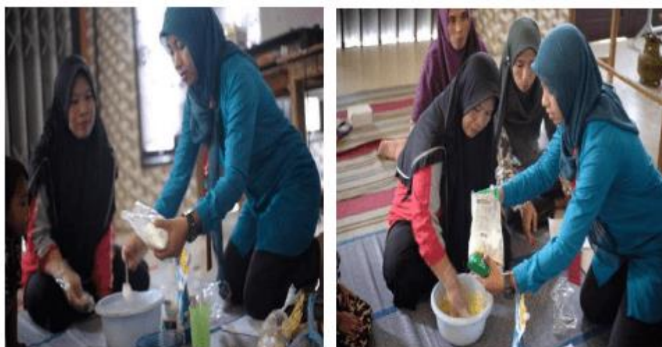
Gambar 2. Pendampingan dengan ibu PKK