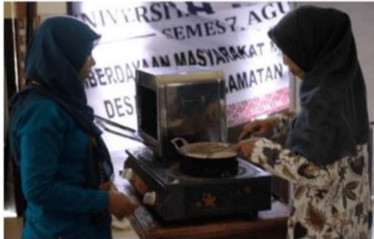
Gambar 3. Ibu PKK membuat isi durian