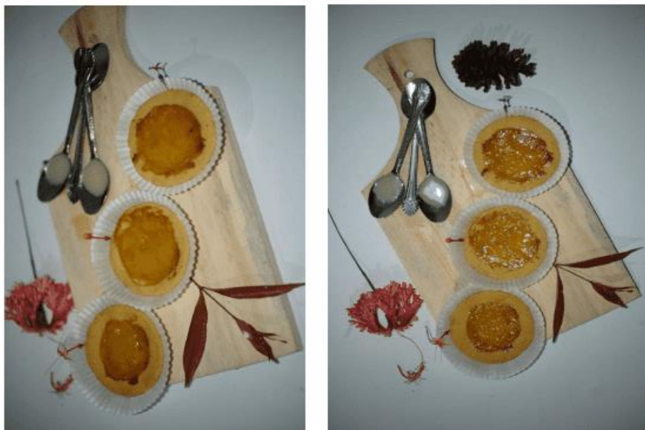
Gambar 4. Hasil Pie Durian ibu PKK