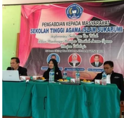
Gambar 2 Kegiatan Pemberian Materi

Adapun kegiatan pembukaan dipandu oleh menderator yang selebihnya untuk materi diberikan kepada dosen sebagai narasumber. Pada kegiatan pertama diberikan materi tentang teori Persiapan menikah dan Nikah dalam Psikolog. Pada kegiatan pengabdian dilakukan dengan metode ceramah, diskusi, tanya jawab dan juga pendampingan. Adapun materi kedua mengkaji tentang Pernikahan menurut agama Islam. Peserta begitu antusias dalam mengikuti kegiatan karena pemateri tidak monoton dalam memberikan materi.