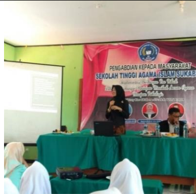
.Gambar 1 Kegiatan Wokshop Bimbingan Pra Nikah