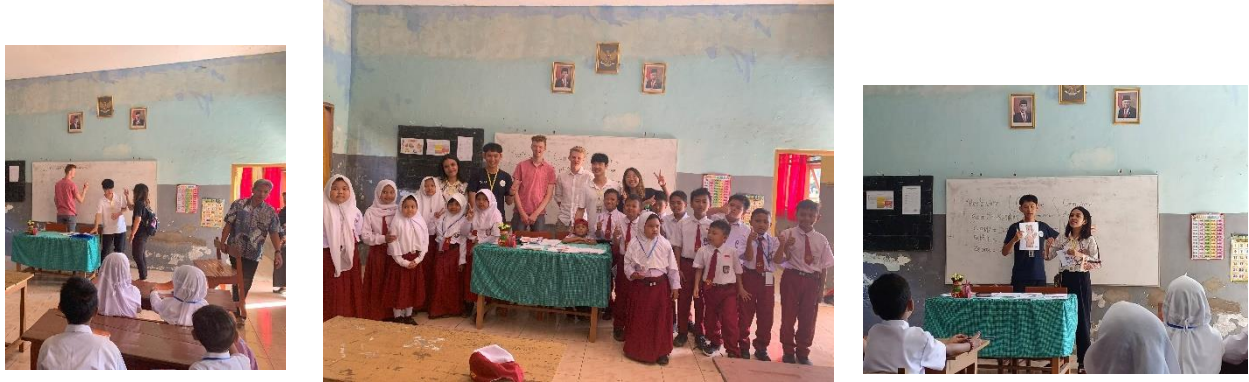
Gambar 4. Kelas Bahasa Inggris

Orang-orang Desa Dilem memiliki pendidikan bahasa Inggris yang rendah dan kami berencana untuk membuat bahasa Inggris program untuk anak-anak dan orang tua sehingga mereka akan memperoleh pendidikan bahasa Inggris yang lebih tinggi untuk mendapatkan gelar yang lebih baik. Kami berencana membuat program bahasa Inggris untuk anak-anak sepulang sekolah dan untuk orang tua kami membuat program bahasa Inggris singkat setelah mereka selesai dengan pekerjaan mereka.