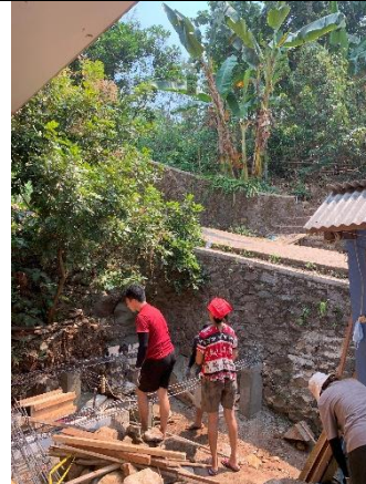
Gambar 7. Membangun Toilet Umum

Memposisikan ulang toilet ke arah Timur karena saat ini memakan terlalu banyak ruang area parkir dan sangat tidak nyaman. Ini terutama bermasalah ketika tamu dari kunjungan Pemkot Mojokerto, karena kendaraan mereka tidak bisa parkir dengan nyaman akibat toilet menghalangi area parkir. Oleh karena itu, sebaiknya toilet dipindahkan agar tidak lagi menempati bagian depan area parkir.