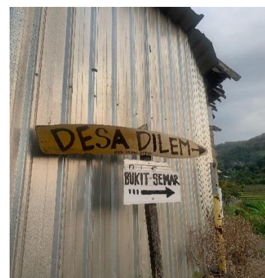
Gambar 1. Lokasi PkM