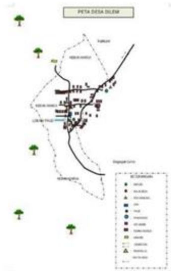
Gambar 2. Demografi Desa Dilem

Desa Dilem menghadapi sejumlah tantangan yang mempengaruhi potensinya. Kurangnya pengetahuan masyarakat tentang lingkungan sekitar, sanitasi yang buruk, serta minimnya fasilitas dan promosi telah meredam pertumbuhan. Fasilitas pendidikan yang kurang memadai. Di samping itu, ketiadaan area publik dan kelembagaan pengelola obyek wisata telah menghambat perkembangan sektor pariwisata lokal. Meskipun demikian, desa ini memiliki sumber daya manusia yang potensial, infrastruktur yang layak, serta objek wisata seperti Bukit Semar. Dengan merencanakan pengelolaan desa bersama masyarakat lokal dan pemerintah serta memanfaatkan potensi pertanian, peternakan, dan jajanan lokal, Desa Dilem berpeluang untuk berkembang menjadi destinasi wisata yang menarik dan berkelanjutan.