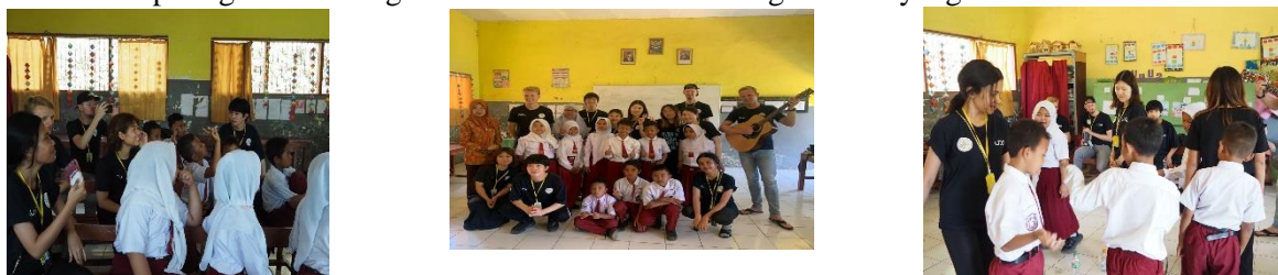
Gambar 6. Kelas Musik

Kami ingin memberikan tanda bahwa kami telah melaksanakan kegiatan di Desa Dilem. jadi kami ingin melakukan tanda peringatan ini dengan membuat mural di dinding sekolah yang tidak berwarna.