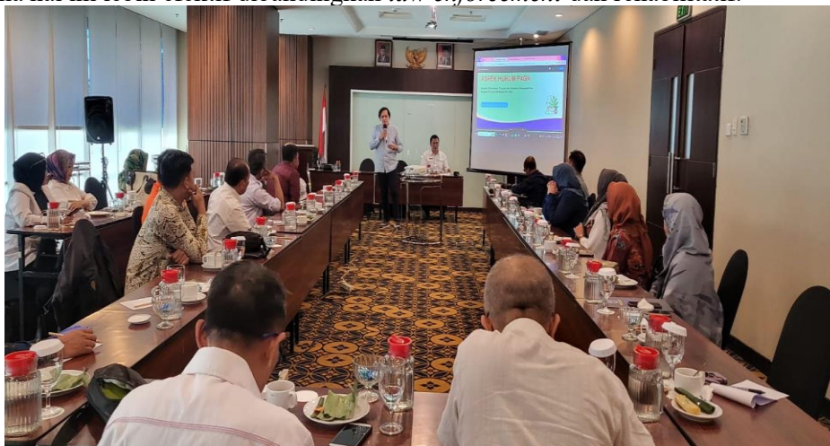
Gambar 3. Kegiatan Pengabdian yang diselenggarakan BNNP Jawa Barat dengan Audiens seluruh Kepala Sekolah SMA Kota Bandung

Pemerintah menargetkan prevalensi penyalahgunaan narkotika di tahun 2024 mengalami penurunan mencapai 1,69% (Anida, 2023). Ketercapaian penurunan prevalensi dapat diperoleh melalui program preventif, karena hal ini lebih efektif dibandingkan law enforcement dan rehabilitatif.