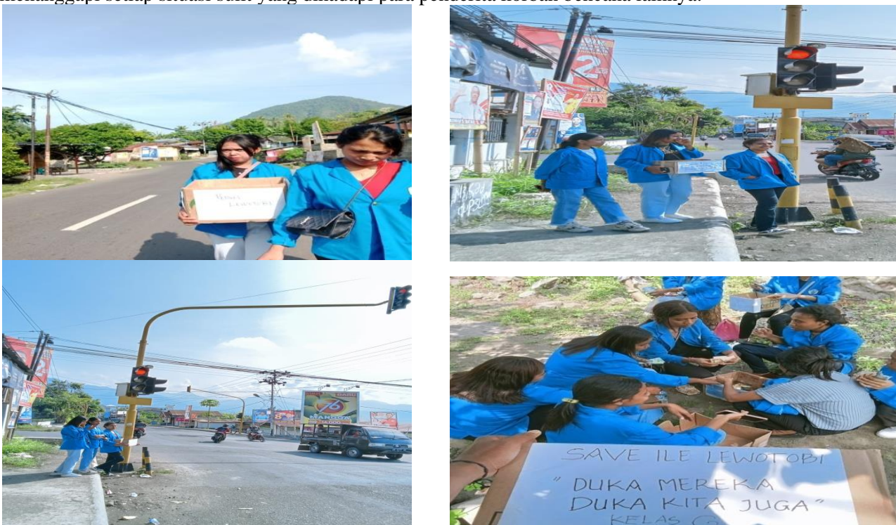
Gambar 2. Saat melakukan pengalangan dana

Terlaksananya kegiatan pengabdian ini diawali oleh adanya inisiasi dari dosen dan mahasiswa program studi Pendidikan Guru Sekolah Dasar Universitas Flores. Dengan mengikuti berita dan informasi dari masyarakat dan media sosial yang merilis berita tentang bencana erupsi gunung Lewotobi di Kecamatan Wulanggintang Kabupaten Flores Timur, maka tergeraklah hati dosen dan mahasiswa untuk melakukan kegiatan penggalangan demi membantu para korban bencana. Hasil yang diperoleh saat dilakukan kegiatan ini adalah bahwa para donatur sangat ikhlas dalam memberikan bantuan berupa sumbangan dana. Penggalangan dana merupakan solusi yang paling tepat untuk menanggulangi hal ini. Oleh karena itu, kepada masyarakat umum khususnya para donatur sangat diharapkan kepeduliannya dalam memberikan sumbangan dana untuk menanggapi setiap situasi sulit yang dihadapi para penderita korban bencana lainnya.