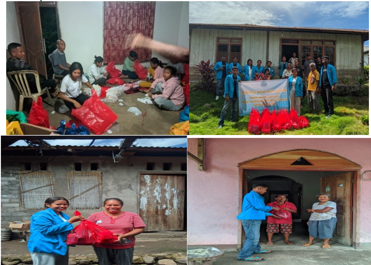
Gambar 3. Dokumentasi saat melakukan kegiatan penyaluran bantuan