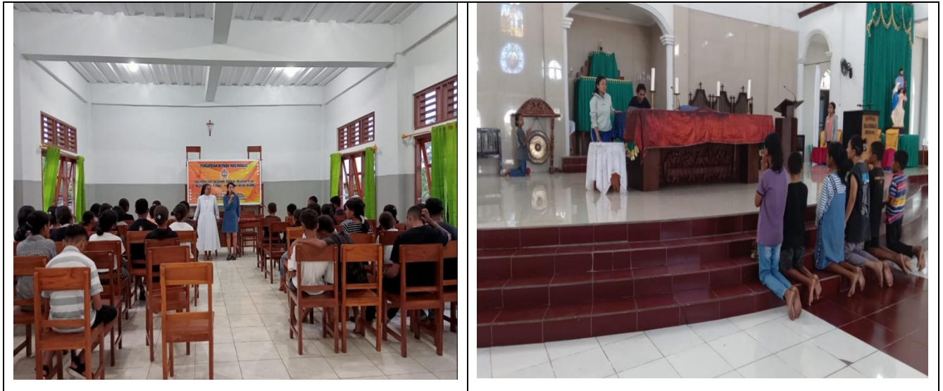
Gambar 2. Kegiatan pendampingan dan pelatihan

Tim PkM melakukan pendampingan berkelanjutan pada minggu selanjutnya. Kegiatan ini dilakukan dengan tujuan agar para misdinar dapat memahami dengan baik dan tidak melupakan apa yang seharusnya dilakukan pada saat perayaan misa berlangsung dan juga bagi misdinar yang lain yang belum sempat hadir agar dapat juga dibekali juga karena pembekalan yang rutin akan membuat para misdinar lebih bersemangat dan lebih percaya diri dalam menjalankan tugasnya.